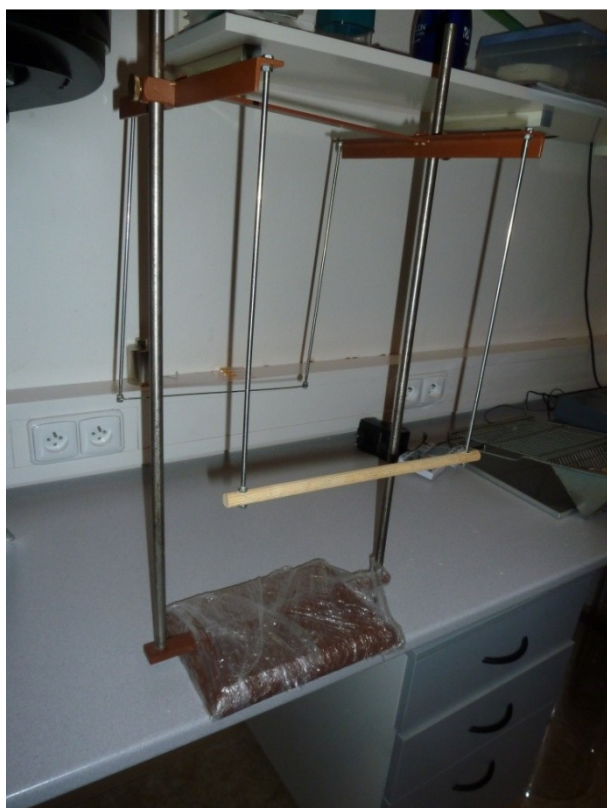
Příloha č. 4: Bar holding test – ilustrační foto