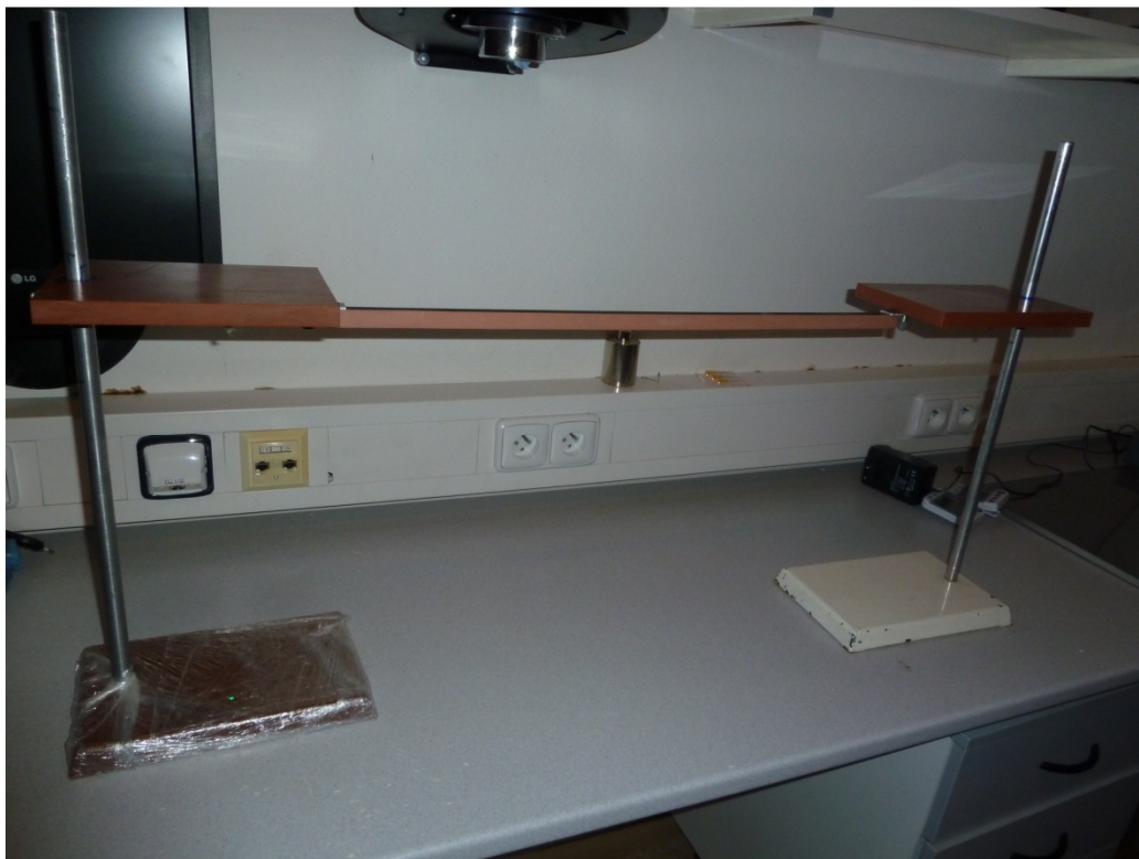
Příloha č. 1: Balnce beam test – ilustrační foto