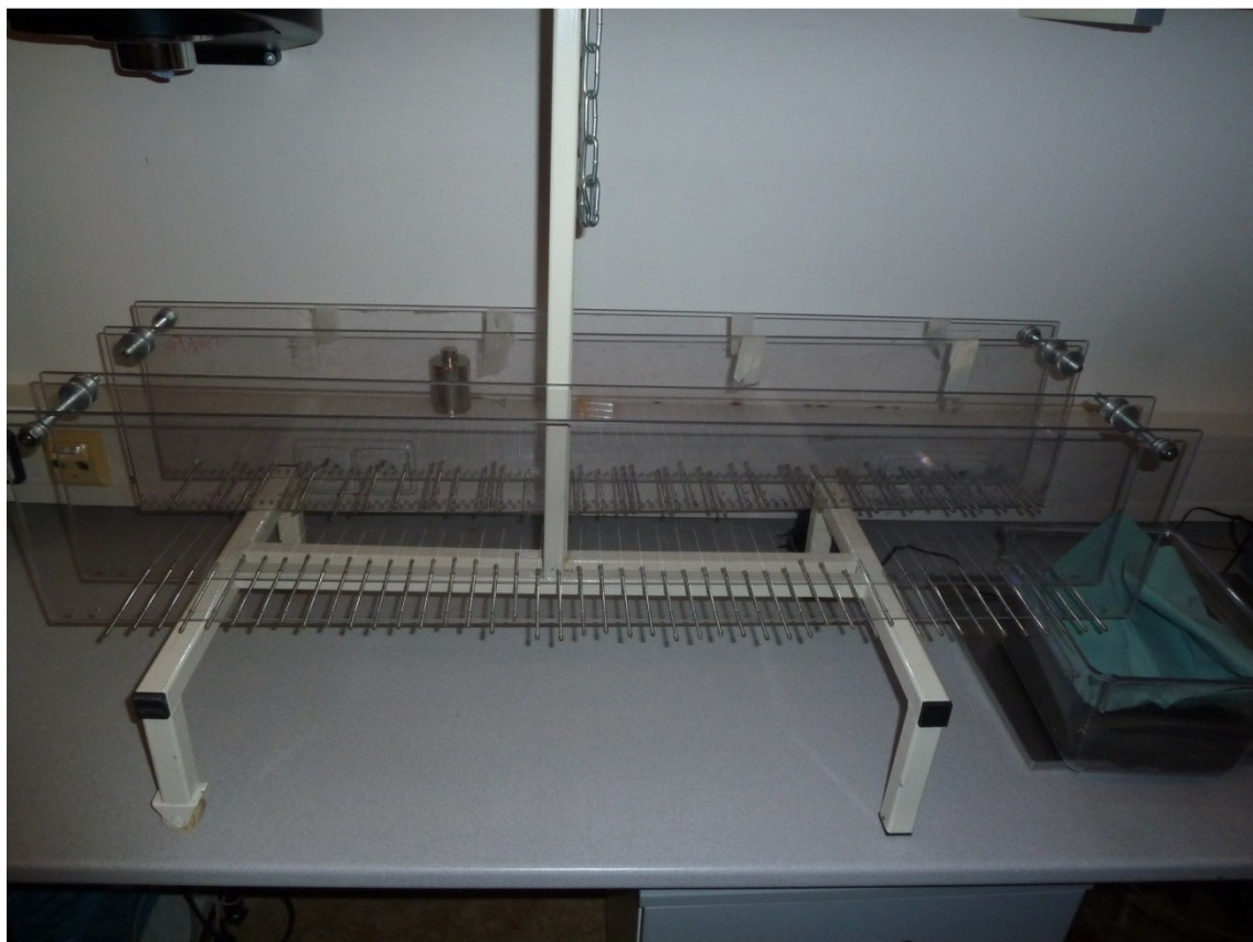
Příloha č. 3: Horizontal ladder rung walking test (pravidelný typ v popředí, nepravidelný typ v pozadí) – ilustrační foto