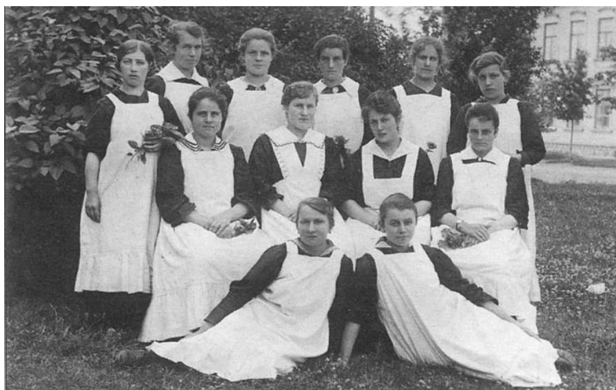
Rok 1917: služební oděv opatrovnic