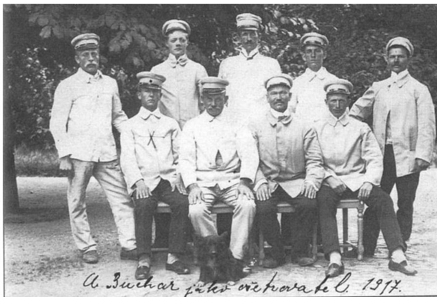
Rok 1917: služební oděv opatrovníků

Příloha 5 – služební oděv opatrovníků z roku 1917 (MUDr. Ivan David, CSc. 2009, Historie psychiatrické péče v Čechách)