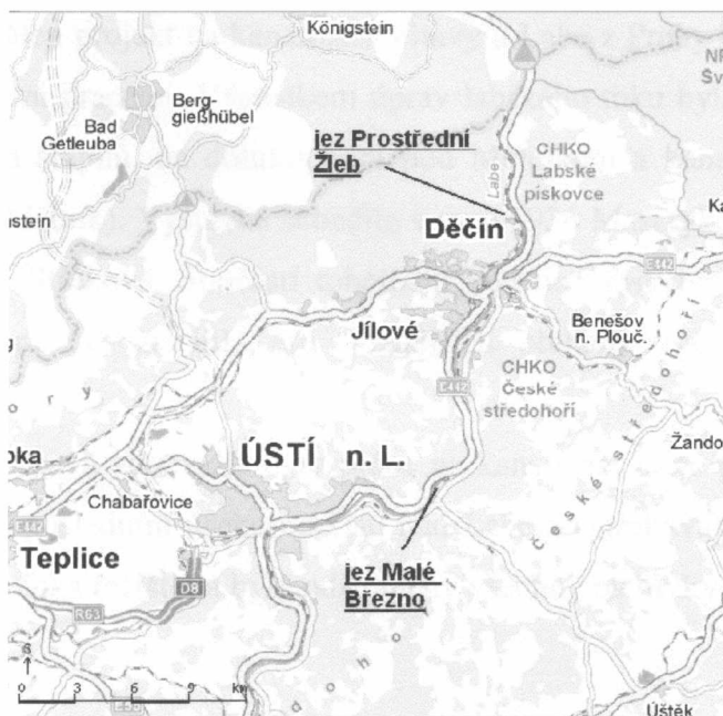
Obrázek č. 1: Mapa plánovaného umístění jezů

Historie regulace labského říčního toku je dlouhá. Její počátky se datují k době Karla IV. Ke zlepšení plavebních podmínek byla v korytě i na březích řeky postupně realizována celá řada zásahů, od odlamování skal a prokopávání mělčin přes výstavbu jezů a říčních přístavů až po kanalizaci Labe na území Československa vybudováním sedmi plavebních stupňů na jeho dolním toku.