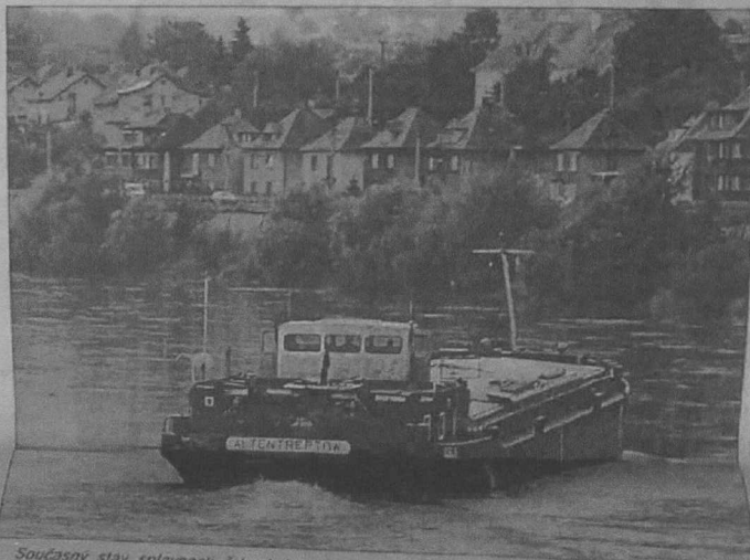
Současný stav splavnosti řeky Labe není rovna ideální. Některé těžké čluny se v určitých úsecích dotýkají dna.

ÚSTÍ N. L./DĚČÍN - Špatná splavnost regulovaného Labe zapříčiňuje v těchto dnech především mezi městy Děčín a Ústí nad Labem dokonce drhnutí plavidel o dno řeky. Problematika ponorů je zjevná hlavně v úseku Labe pod Ústím nad Labem, kde dochází při nízkých vodních stavech k enormně dlouhým přerušením plavby. Nízké ponory pak ovlivňují konkurenceschopnost plavby. Pokud by totiž došlo například k likvidaci dnes již málo intenzivní zahraniční plavby na Labi, přibude na hranicím přechodu Činovec k dnešním pří-