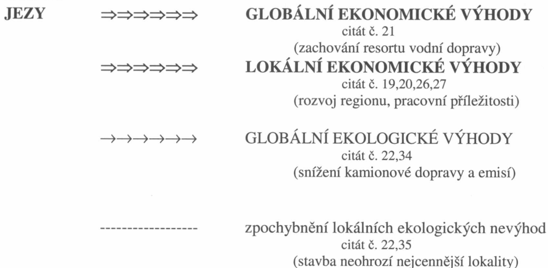
Schéma č. 2: Ekonomicko-ekologická argumentace připisovaná diskurzem straně zastánců

Vysvětlivky: ⇒ hlavní důsledek; → vedlejší efekt; -- reakce na argumenty protistrany