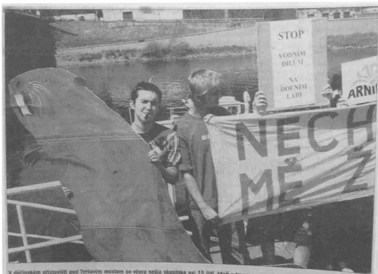
V děčínském přístavišti pod Tyršovým mostem se včera sešla skupinka asi 15 lidí, kteří s transparenty přivítali loď Hamburg.