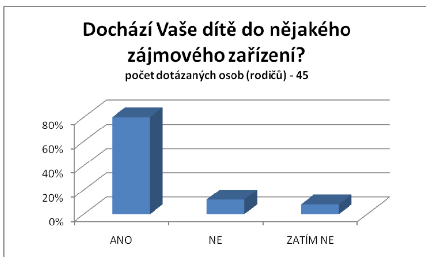
3) Graf návštěvnosti a umístění dítěte v zájmových aktivitách. Počet dotázaných rodičů byl 45.