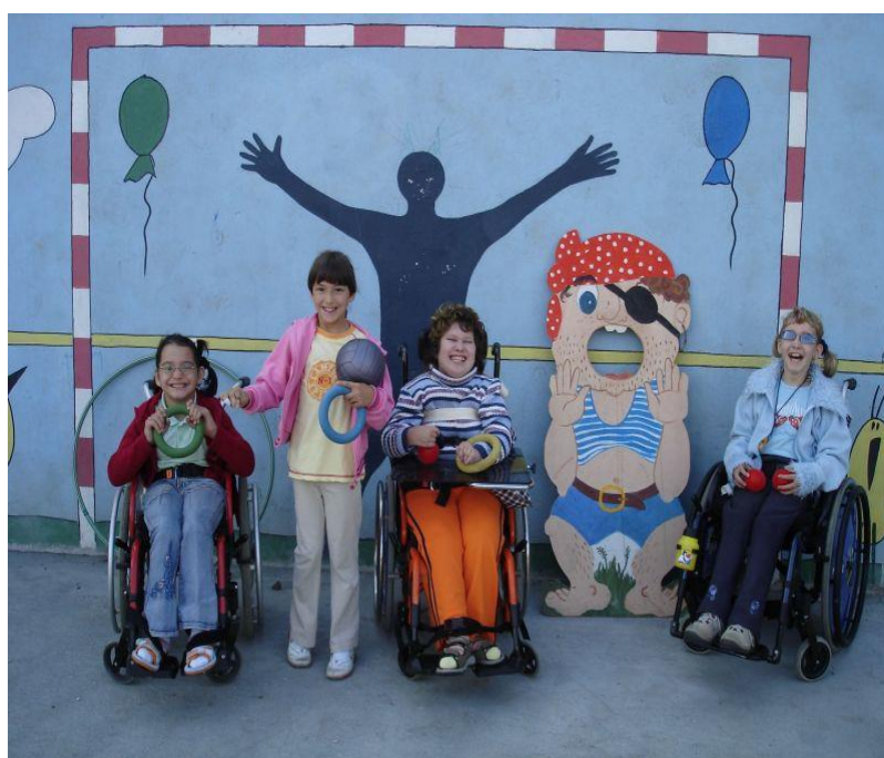
Sportovní den na školním hřišti