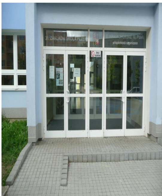
Bezbariérový vstup do školy