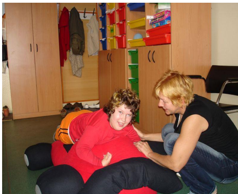
Relaxace ve speciální učebně