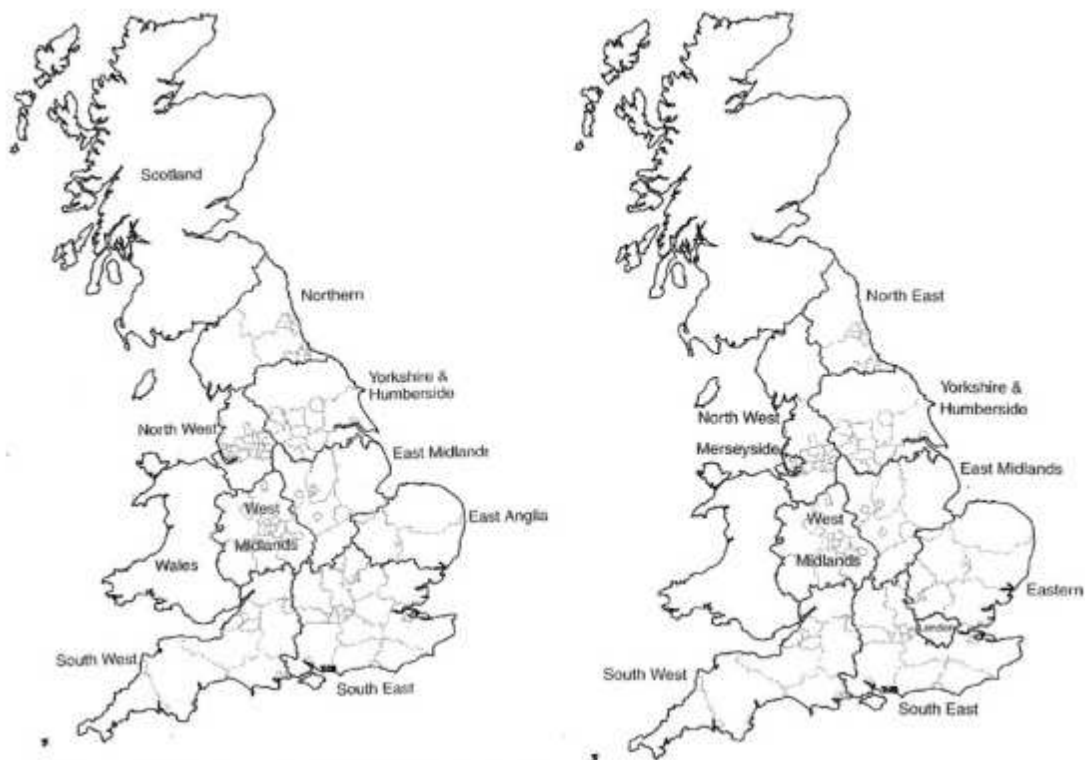
Obr. 2 Vymezení standardní regionů po roce 1974 a vymezení regionů pro GOs po roce 1994 (Merseyside se později stalo součástí regionu North West). 103

Hlavním kritériem pro stanovení hranic regionů v devadesátých letech 20. století byla potřeba propojit ekonomické faktory se stávající podobou lokální správy a v některých případech sladit regionální a místní rovinu prostřednictvím reorganizace lokální správy vytvořením její jednotné podoby na celém území Anglie. 104 Kulturní identita i historické hledisko byly při tvorbě regionů s výjimkou regionu North East do značné míry opomenuty. 105 Také New Labour na konci devadesátých let při stanovování hranic regionů pro potřeby RDAs vycházela z podoby stanovené v roce 1994 a nadále tak při ustavení hranic upřednostňovala ekonomická a správní kritéria. Došlo pouze k dílčím změnám ve vytyčení hranic a počet regionů byl ustaven na osm: North East, North West, Yorkshire and The Humber, West Midlands, East Midlands, East of