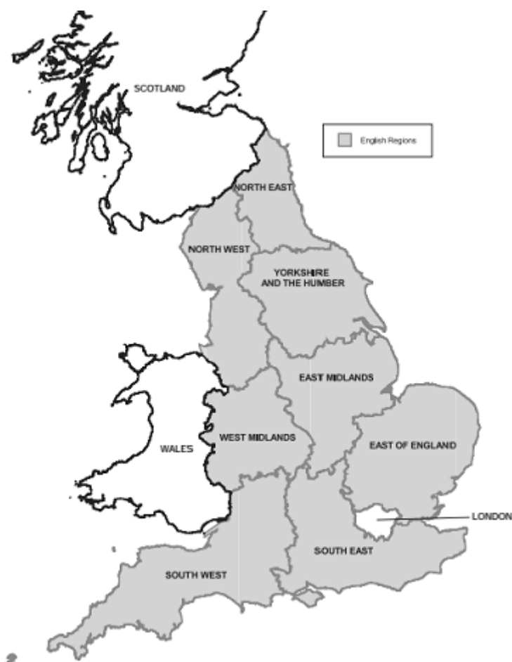
Obr. 3 Vymezení regionů pro RDAs a pro volená regionální shromáždění. 111

Skutečnost, že anglické regiony nevycházejí z přirozených regionů existujících na anglickém území, je ilustrována názvy, které jsou pro ně již od druhé světové války používány. Při detailním pohledu na regiony je zřejmé, že jejich pojmenování nevyhází z historicky zavedených názvů. Příkladem opuštění tradičního pojmenování je název Wessex, který označoval oblast původního anglo-saského království rozkládajícího se mezi současnou hranicí regionů South West a South East a hranicí Cornwallu. Současné pojmenování těchto regionů však původní název neobsahuje, přestože je pojem Wessex široce používán nejrůznějšími společenskými, obchodními a sportovními organizacemi. 112 Pojmenování anglických regionů ve většině případů tak vychází pouze z jejich polohy v rámci Anglie a nemá širší souvislosti. Jeffery je dokonce označil za