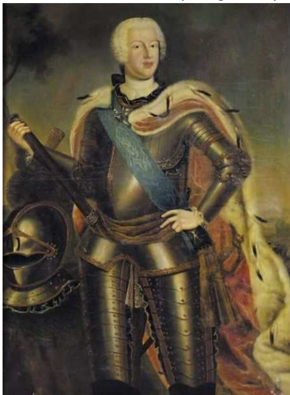
Anton Ulrich Brunšvický ( http://de.wikipedia.org )