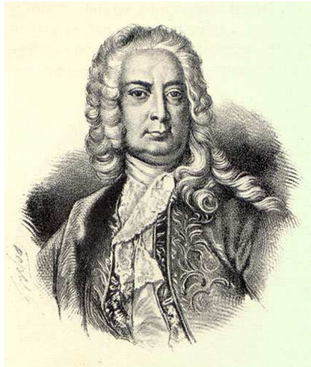
Artemij Petrovič Volynskij ( http://ru.wikipedia.org )