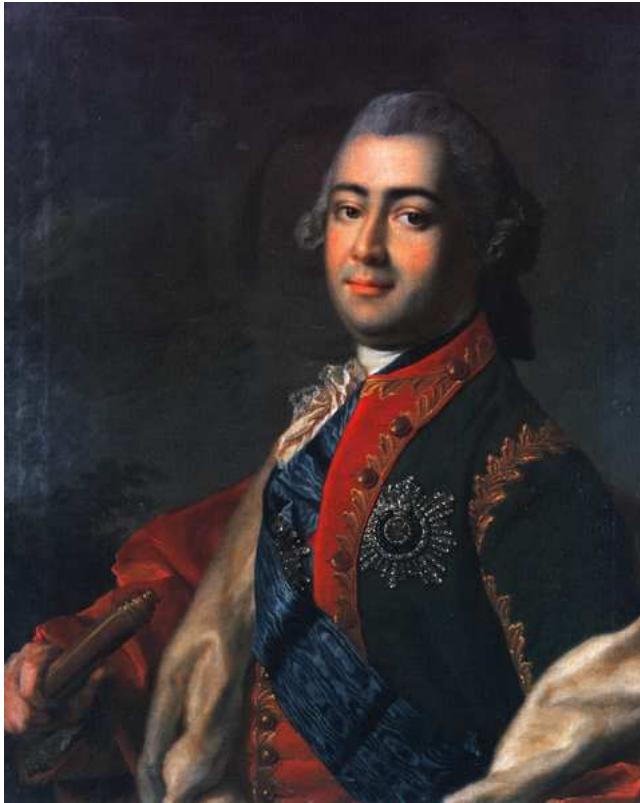
Alexej Grigorjevič Razumovskij ( http://en.wikipedia.org )