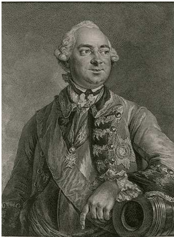
Petr Ivanovič Šuvalov ( http://en.wikipedia.org )