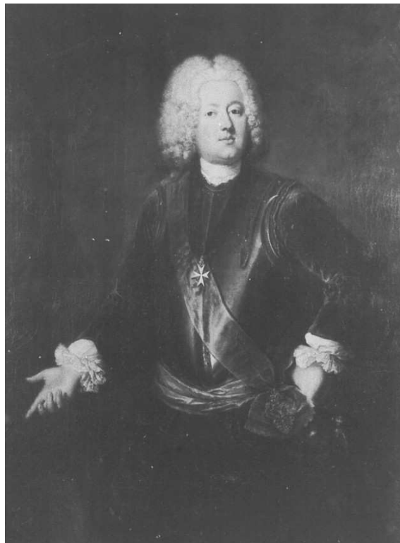
Moritz Karl Lynar