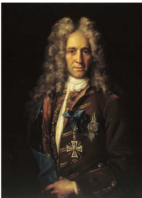
Gavril Ivanovič Golovkin ( http://ru.wikipedia.org )