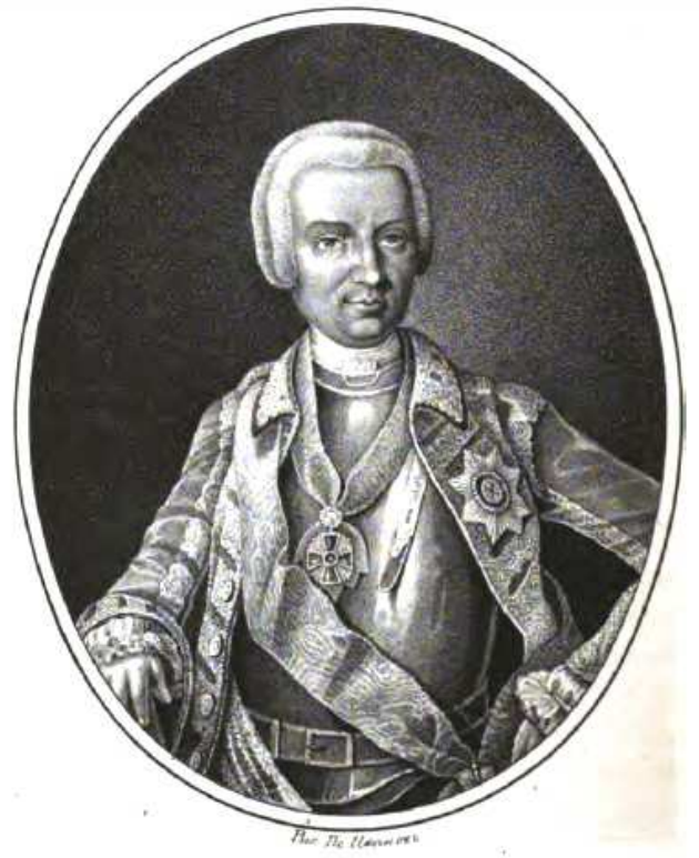
Alexandr Ivanovič Šuvalov ( http://ru.wikipedia.org )