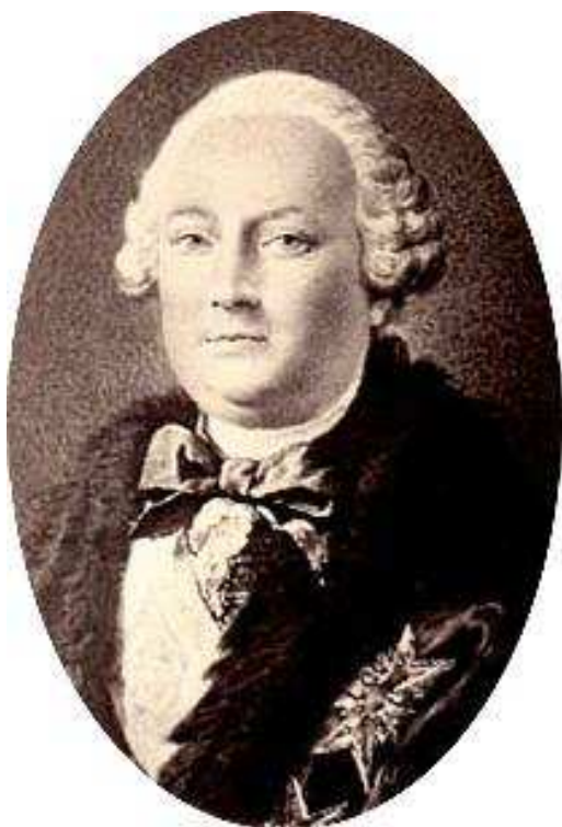
Jacques-Joachim Trotti markýz de la Chétardie ( http://ru.wikipedia.org )