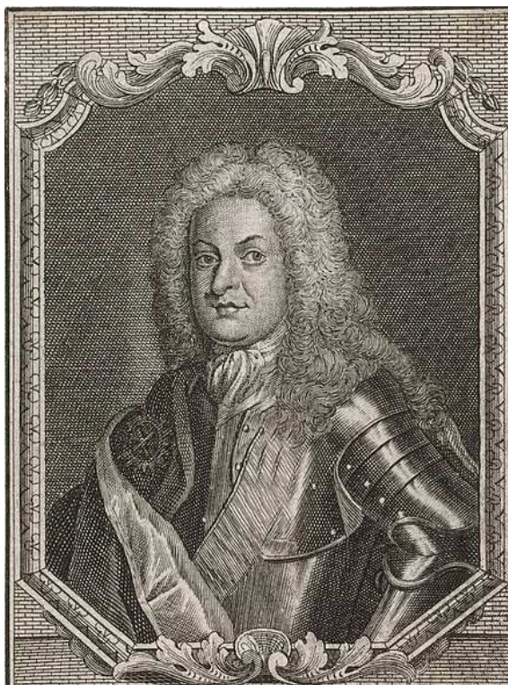
Andrej Ivanovič Ostermann