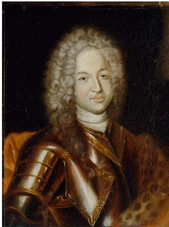
Michail Gavrilovič Golovkin