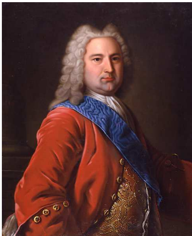
Ernst Johann Biron ( http://en.wikipedia.org )