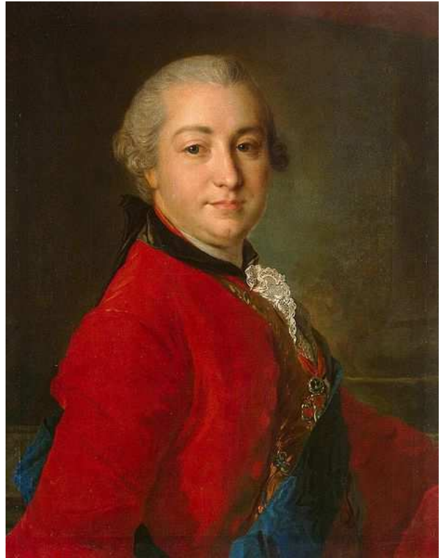
Ivan Ivanovič Šuvalov ( http://ru.wikipedia.org )