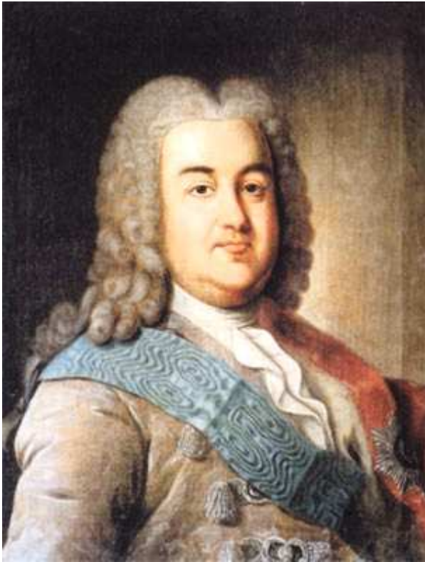
Alexej Michajlovič Čerkasskij ( http://en.wikipedia.org )