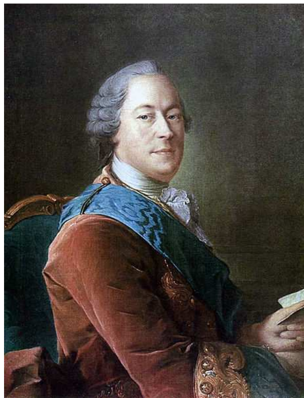
Michail Illarionovič Voroncov ( http://ru.wikipedia.org )