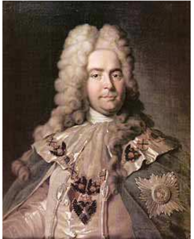
Pavel Ivanovič Jagužinskij