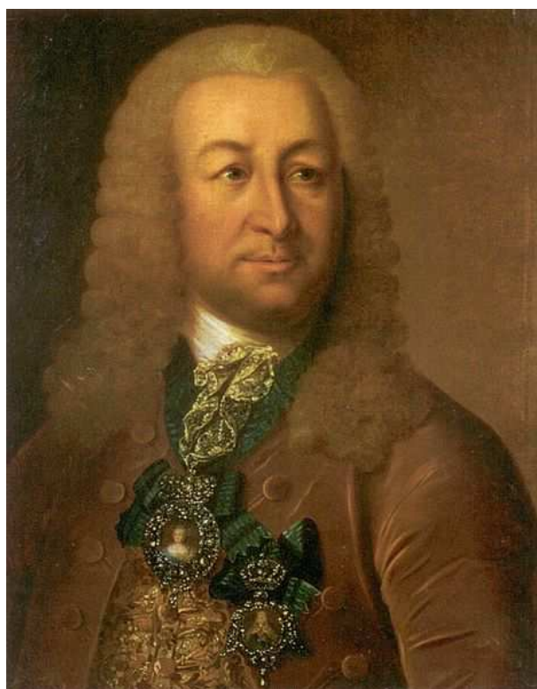
Jean Armand Lestocq