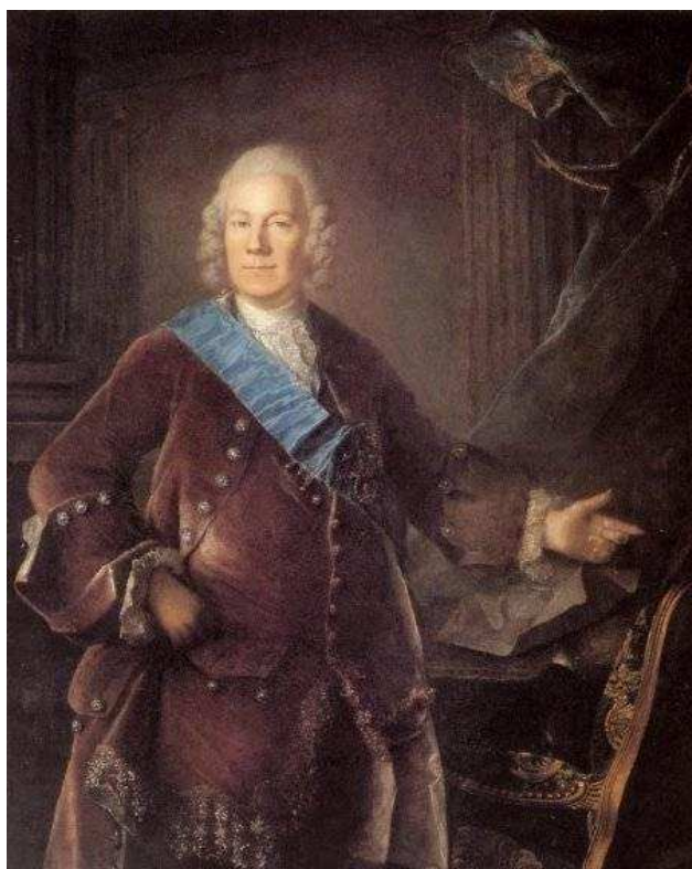
Alexej Petrovič Bestužev-Rjumin ( http://en.wikipedia.org )