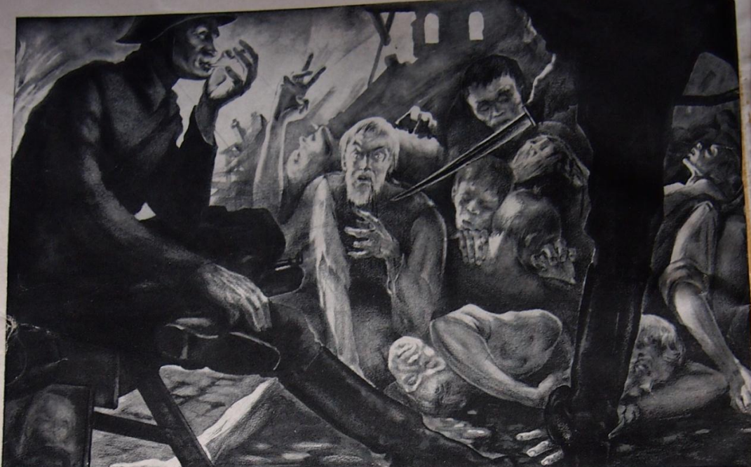
"AND ONE WHO WAS DYING OPENED HIS EYES, FOR HE SMELLED SMOKE AND STARED AT THE SKIES . . . LURID WITH SMOKE AND FLAME"