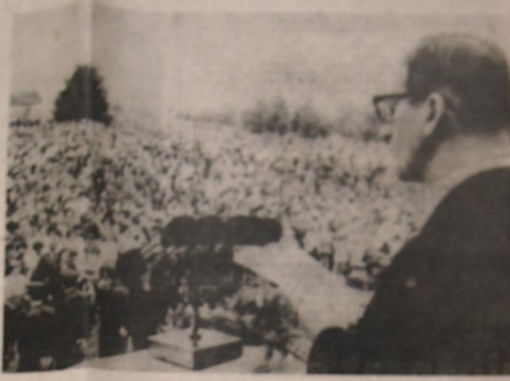
V divokém ústředním městě se uskutečnila slavnostní akce k výročí 10. let od vzniku lidické republiky. Na snímku přední věže Československé lidové armády.

Člověk organizace "Křesťanství" není žádnou zvláštností. Je to člověk, který se snaží být lepší než ostatní. Je to člověk, který se snaží být lepší než ostatní. Je to člověk, který se snaží být lepší než ostatní.