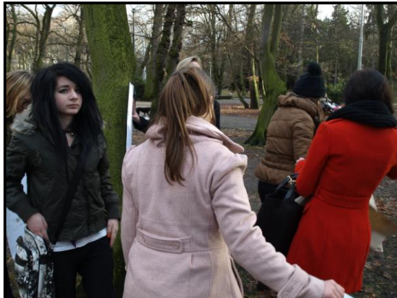
Krajinomalba v plenéri- ukážka prác