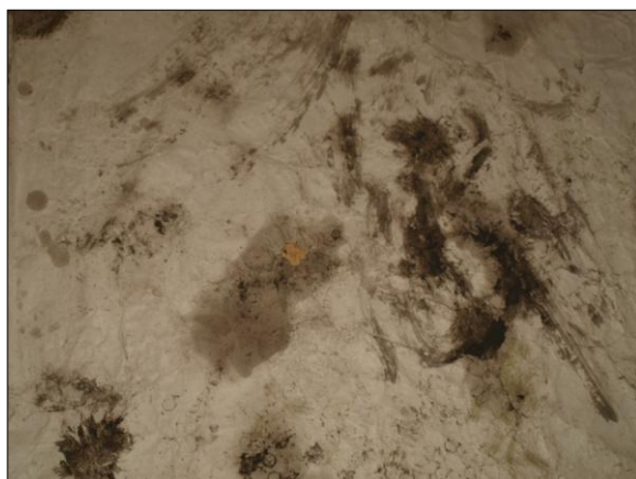
Príloha 5: Fotografie štruktúr