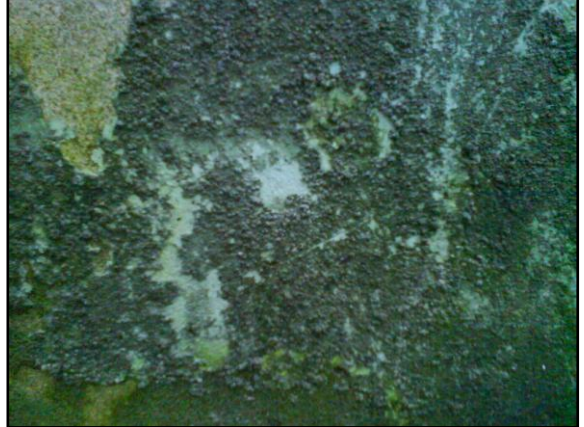
Príloha 6: Fotografia ako záznam maľby