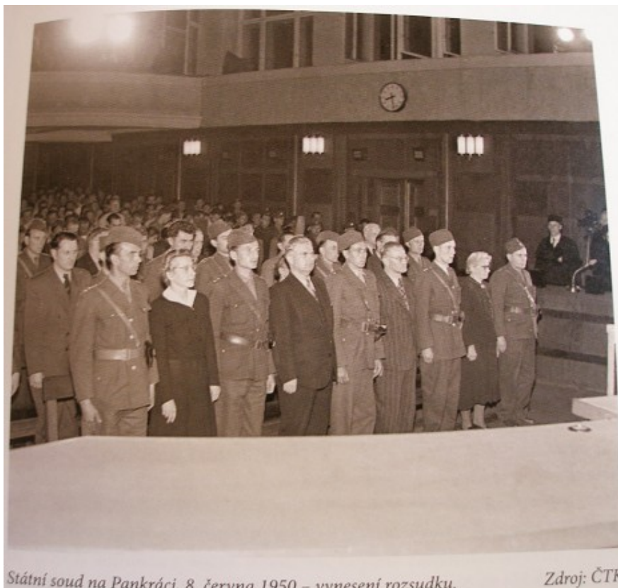
Státní soud na Pankráci. 8. června 1950 – vnesení rozsudku.