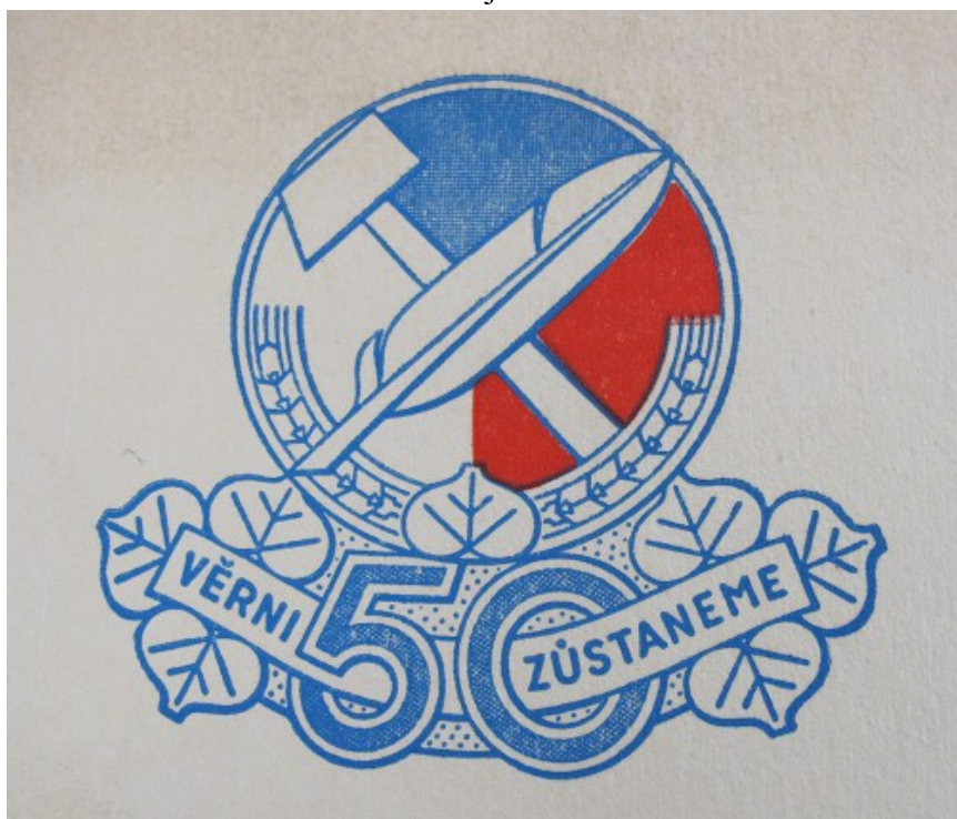
NA, f. ÚS USS-AMV, 35-8-1