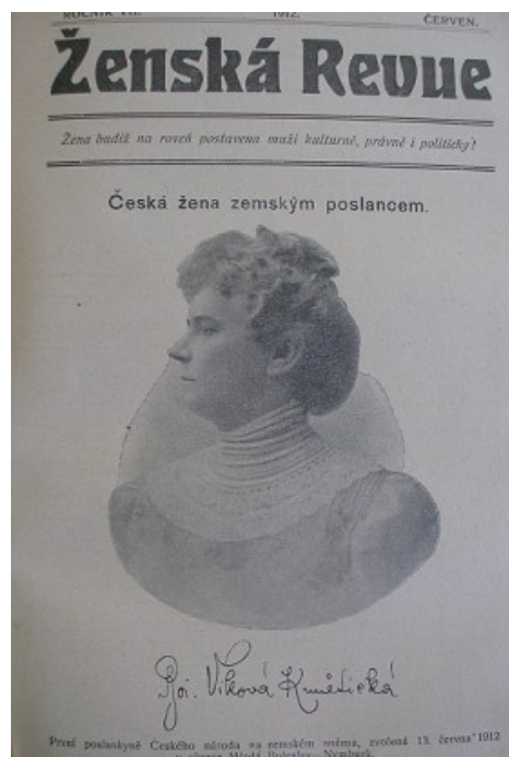
ABS, f. 310, 73-36