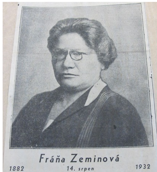
NA, f. MZV – VA I, k. 4136