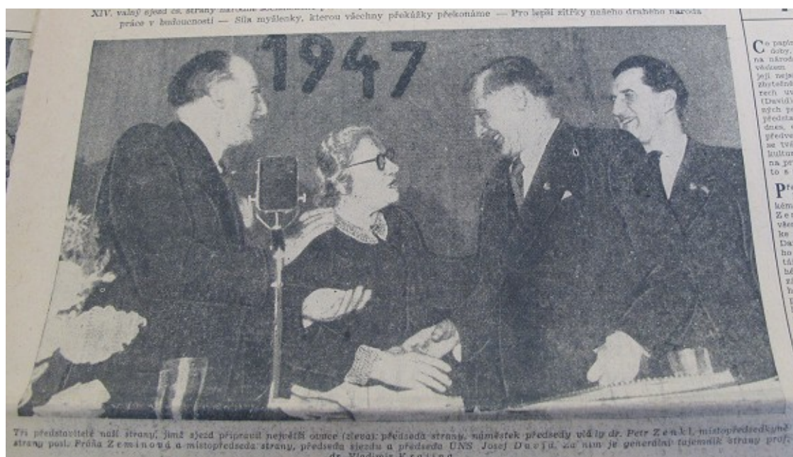
NA, f. MZV - VA II, 1331