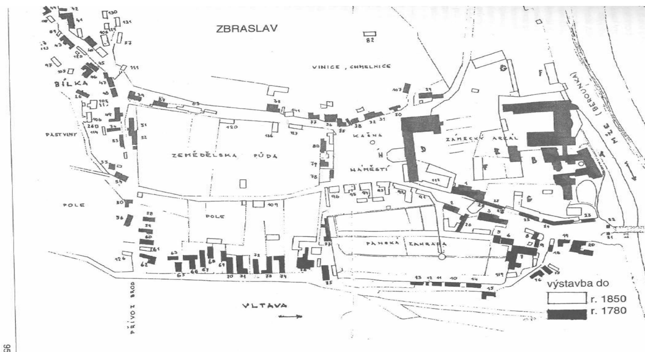
Mapka č. 6 126