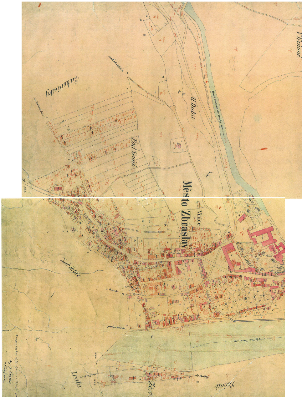
Císařský otisk 1886