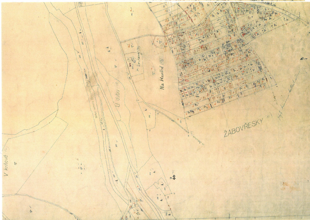
Císařský otisk 1923