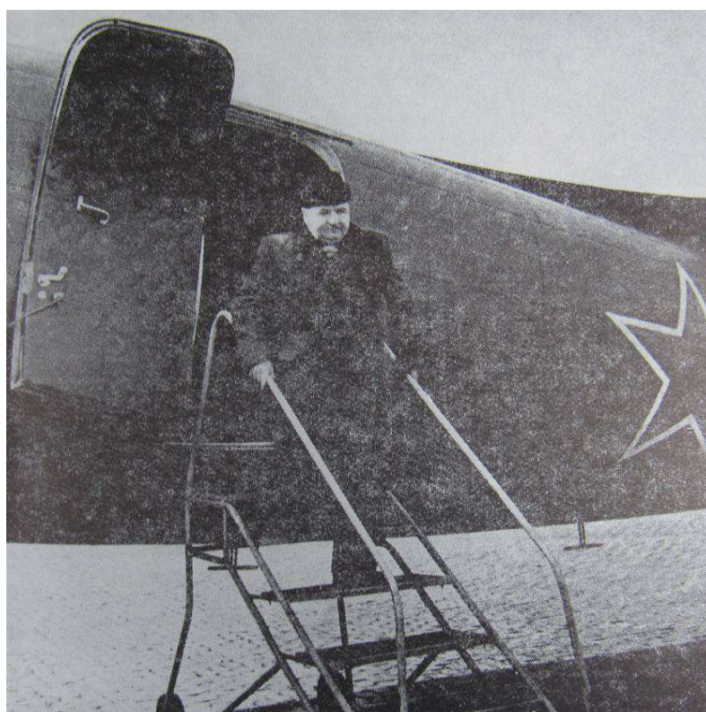
Příloha 12: Klement Gottwald po návratu ze Stalinova pohřbu. 12