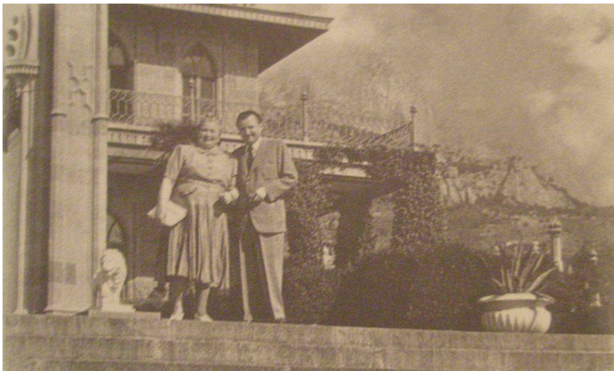
Příloha 1: Klement a Marta Gottwaldovi během dovolené na Krymu. 1