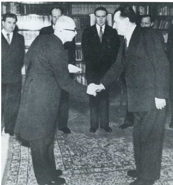
Příloha 3: Nová vláda složila 27. února 1948 slib do rukou prezidenta Beneše. 3

Akční výbor zaměstnanců pražského Hradu. 55. s p ČTK P r a h a 27.února. Zástupci všech složek a organizací v kanceláři prezidenta republiky ustavili 25.t.m. akční výbor, který, jak praví ve svém prohlášení - stojí pevně za novou vládou Klementa Gottwalda na cestě k uskutečnění socialismu a pokroku, k lepším zítřkům národa a celé Československé republiky. "Voláme všechny zaměstnance v kanceláři prezidenta republiky! praví se v závěru prohlášení, "k plnění jejich povinností a vybízíme je ke svornosti a spolupráci, k zajištění klidu a pořádku v našem úřadě. Ať žije Československá republika, ať žije prezident dr. Edvard Beneš, ať žije Klement Gottwald a jeho nová vláda, ať žije Československo-sovětské přátelství!" ke/no