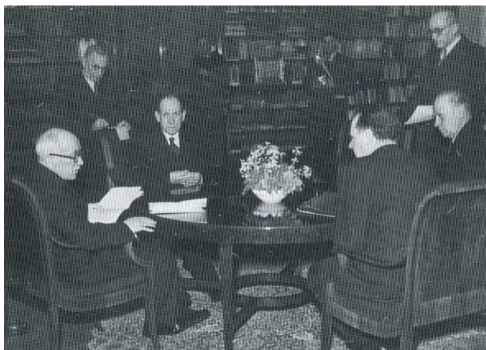
Příloha 2: Prezident Beneš jedná 25. února 1948 s komunisty. 2