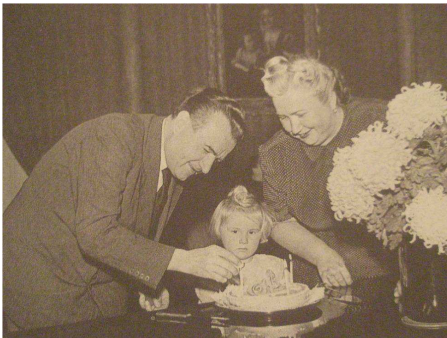
Příloha 11: Manželé Gottwaldovi s vnučkou. 11