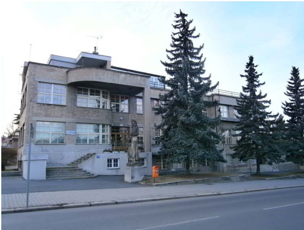
Obr .č. 5 Bývalý Masarykův dům sociální péče