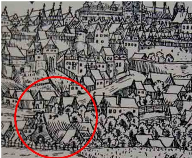
Obr. č. 1 Kostel sv. Víta

Zdroj: MĚSTECKÁ, Sylva, SOSNOVEC, Pavel. Mladá Boleslav od počátku věků do novověku [online]. Mladá Boleslav: sdimension, 2003 [cit. 18.5.2012]. Dostupné z: http://programy.mb-net.cz/mb-pravek-novovek/MB.htm .