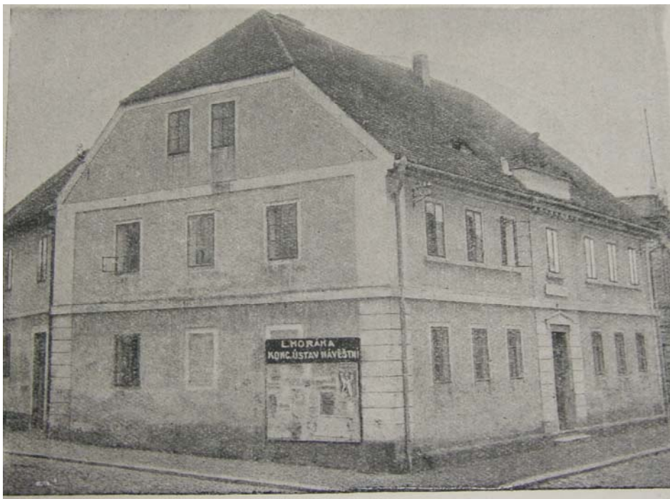
Obr. č. 2 Špitál Kateřiny Milítké