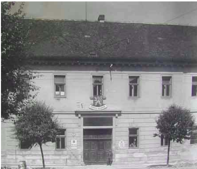
Obr. č. 4 Vojenská nemocnice roku 1920

Zdroj: MĚSTECKÁ, Sylva, SOSNOVEC, Pavel. Mladá Boleslav od počátku věků do novověku [online]. Mladá Boleslav: sdimension, 2003 [cit. 18.5.2012]. Dostupné z: http://programy.mb-net.cz/mb-pravek-novovek/MB.htm .