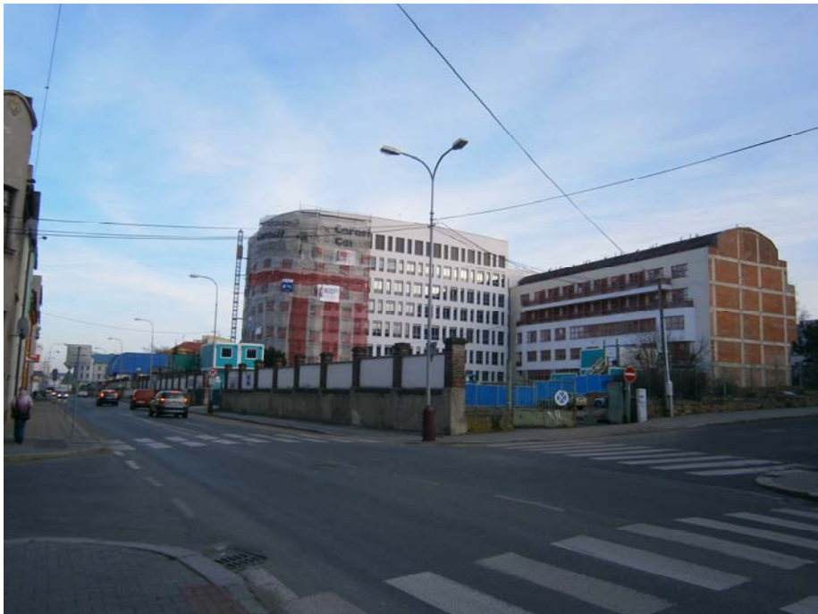
Obr. č. 6 Stavba nového interního pavilonu, Klaudiánova nemocnice