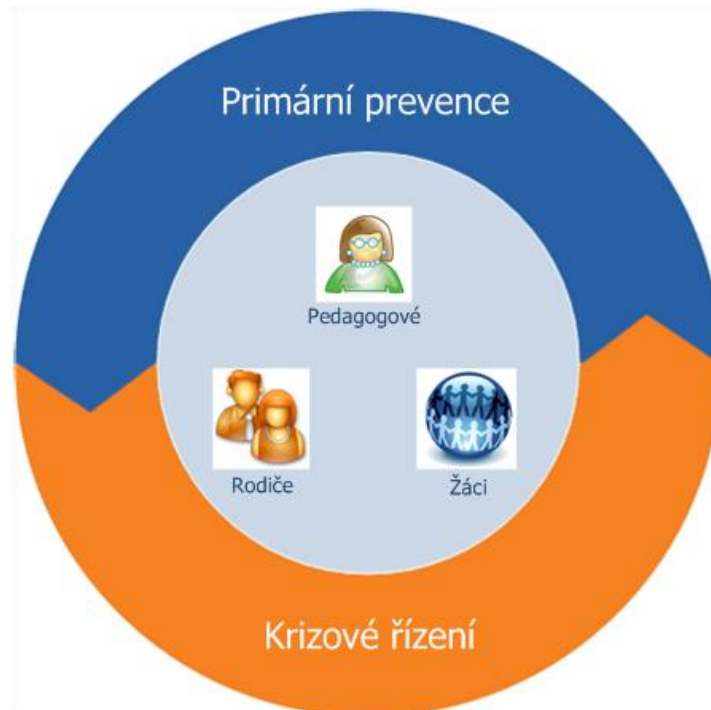
Schéma č.1: Schéma komplexního preventivního působení ve škole (Exnerová, 2009, s.9)

škol a školských zařízení (Č.j. 24 246/2008-6). Aktuálně ho můžeme také nalézt v několika publikacích vydaných Klinikou adiktologie, 1. Lékařské fakulty Univerzity Karlovy Praha v letech 2011 a 2012 (viz. seznam literatury).