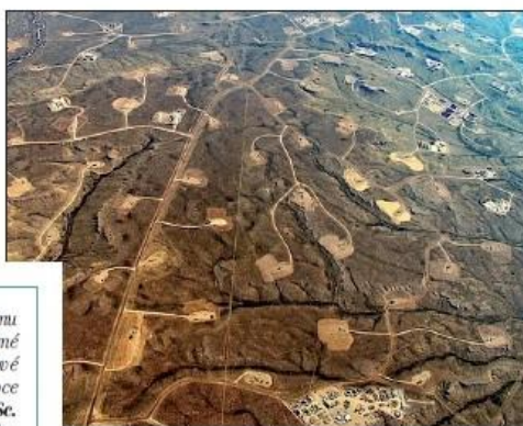
Měsíční krajina - tak vypadají vrty v praxi.

Nejdříve se vrtá svislý vrt do 2 až 4 kilometrů. Následuje kilometr dlouhý vodorovný vrt. Pomocí výbuchů se ve vodorovné části vytvoří síť trhlin. Do nich se žerou miliony litrů vody a desítky tun toxické chemie pomocí desítek naftových agregátů. Pro jeden vrt je třeba až 3 hektary plochy, pro těžbu jsou třeba desítky, stovky vrtů. ■