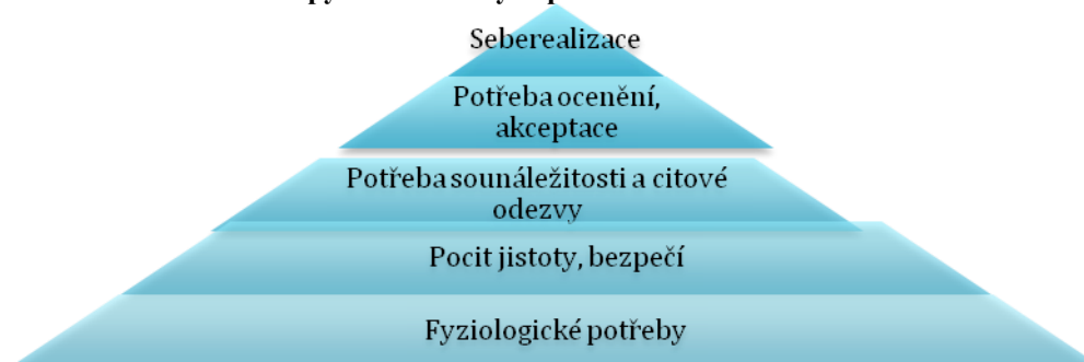
Obrázek 3: Maslowova pyramida lidských potřeb

Často se můžeme setkat s hierarchií potřeb podle amerického psychologa Abrahama Harolda Maslowa. Jak uvádí KOHOUTEK (2009), Maslow roku 1943 sestavil pyramidu lidských potřeb od břicha po hlavu.