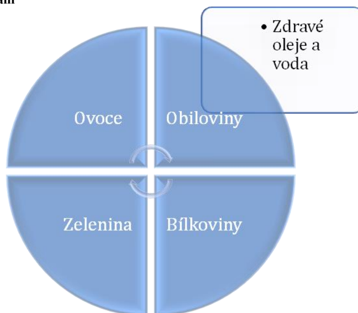
Obrázek 1: Správný talíř

Jak tedy jíst? Rozhodně ne podle diet, které najdeme v časopisech, protože ty se každý měsíc mění. Jejich cílem může být pouhé hubnutí a ne zdraví. Základem je čerstvá a kvalitní strava s obsahem vitamínů, minerálů, probiotik, tuků, olejů, vlákniny a fytochemikálií. Kvalitní strava začíná v půdě. Je důležitý organický původ, tedy zdravá půda. Pokud půda bude obsahovat chemické látky, dostanou se po konzumaci zeleniny do nás. Tuto zeleninu a trávu bude spásat i dobytek, takže se škodliviny dostanou i do jeho masa, které později sníme my (Slimáková, 2012).