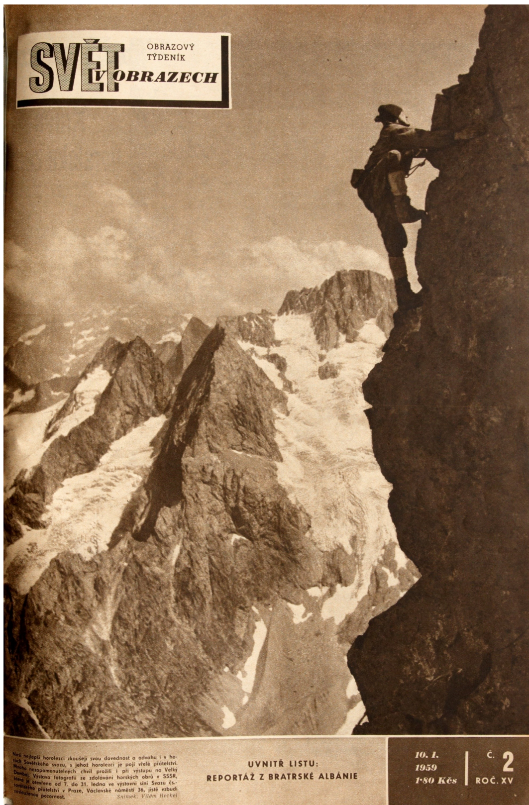
Příloha č. 2: První titulní fotografie Viléma Heckela ve Světě v obrazech , 1959, č. 2.