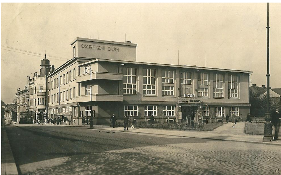
4 Bio Svět v Okresním domě: biograf byl ve druhé polovině 20. století přebudován na kinokavárnu, funguje tak dosud