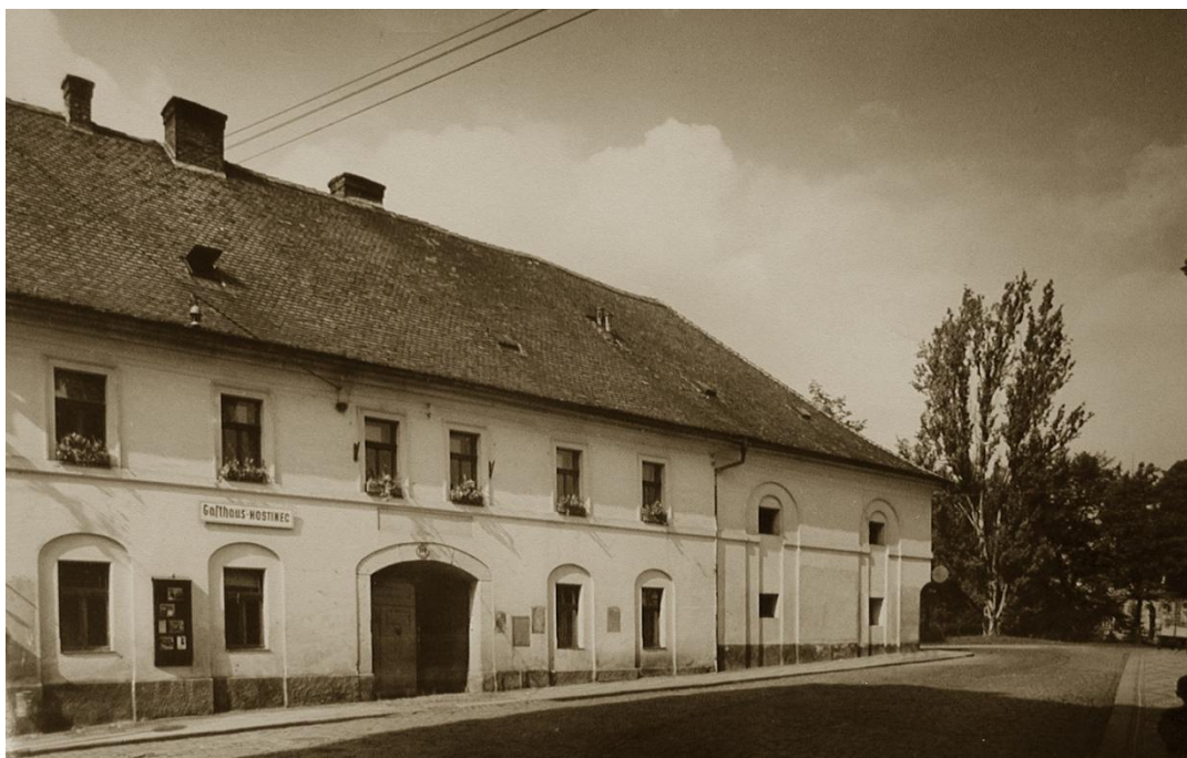
2 Pivovarská ulice: ve dvoře hostince se nacházel vstup do biografu Libuše