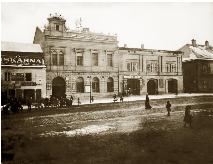
3 Biograf Legie na Novém náměstí: v nejvyšším domě na fotografii biograf fungoval až do 90. let