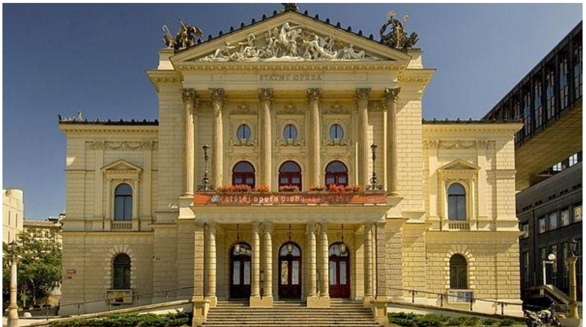
Příloha č. 1: Exteriér budovy Státní opery Praha, Legerova 75