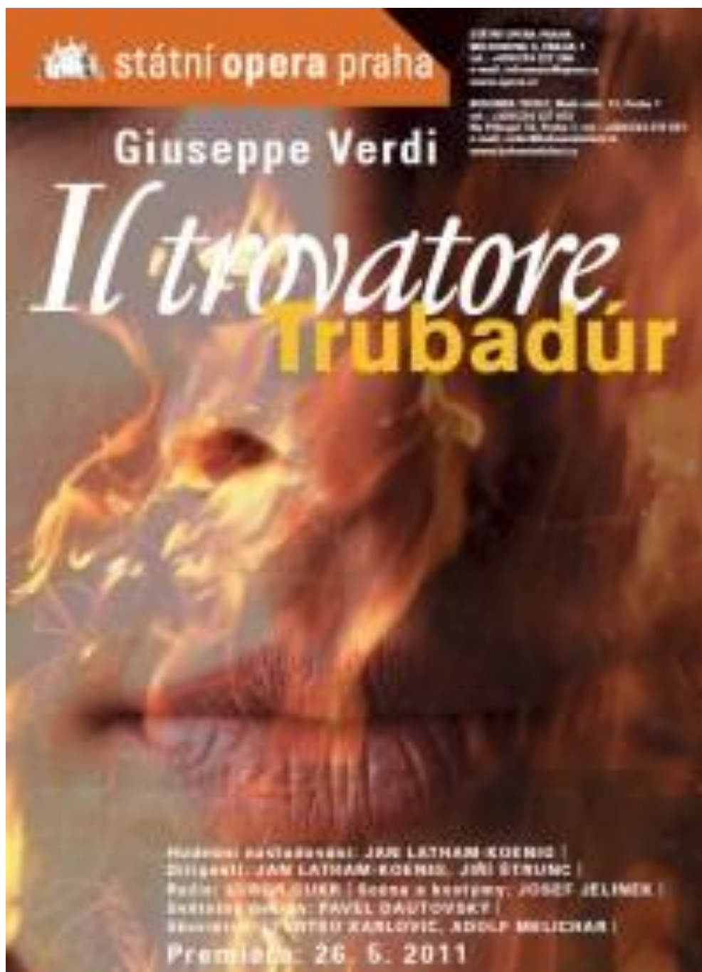
Příloha č. 6: Leták/brožura operního představení SOP (obrázek)