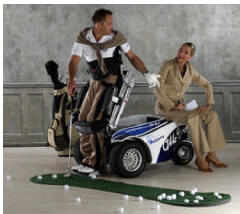
Obr. 3: Ukázka golfového odpalu hráče s jednostrannou podkolenní amputací. (czdga, 2013, [online])