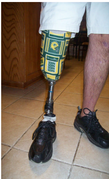
Obr. 8: Protetické chodidlo SACH. (Otto Bock, 2013, [online])