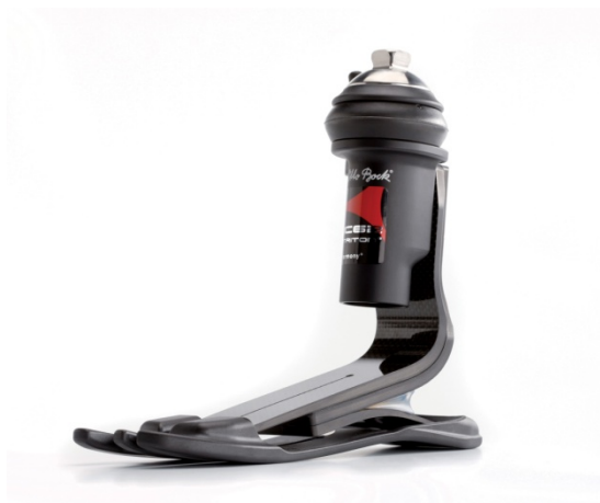
Obr. 11: Protetické pylonové chodidlo. (Otto Bock, 2013, [online])