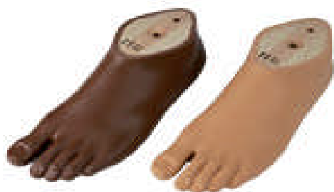
Obr. 9: Protetické dynamické chodidlo Trias. (Otto Bock, 2013, [online])