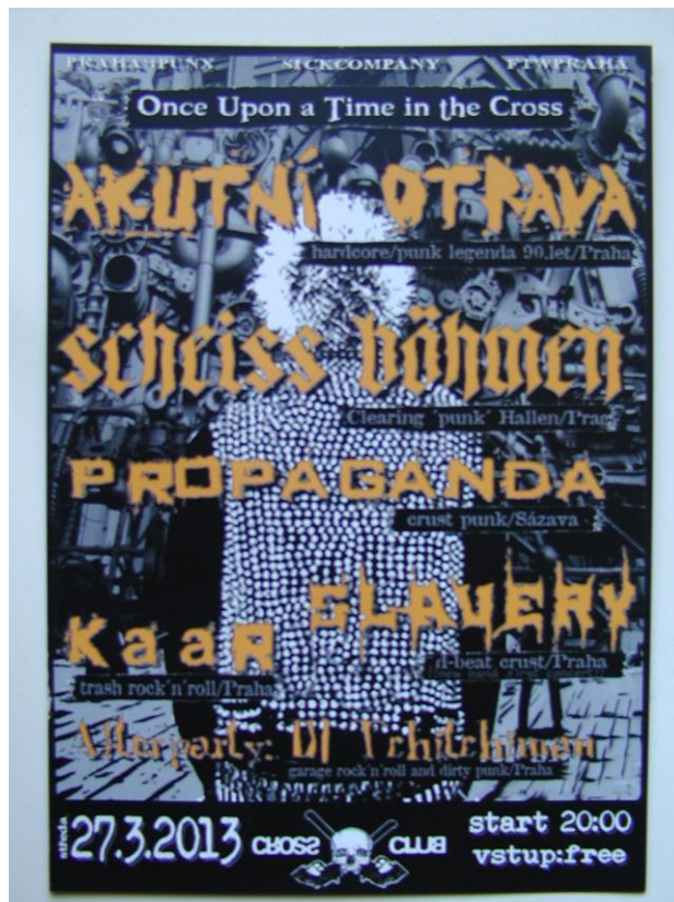
Obr. 1: Pozvánka na punkový festival