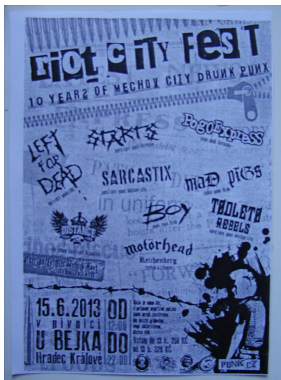
Obr. 2: Pozvánka na punkový festival