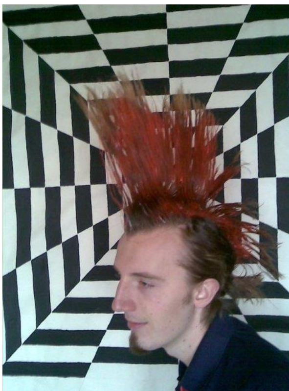
Obr. 4: „Číro“