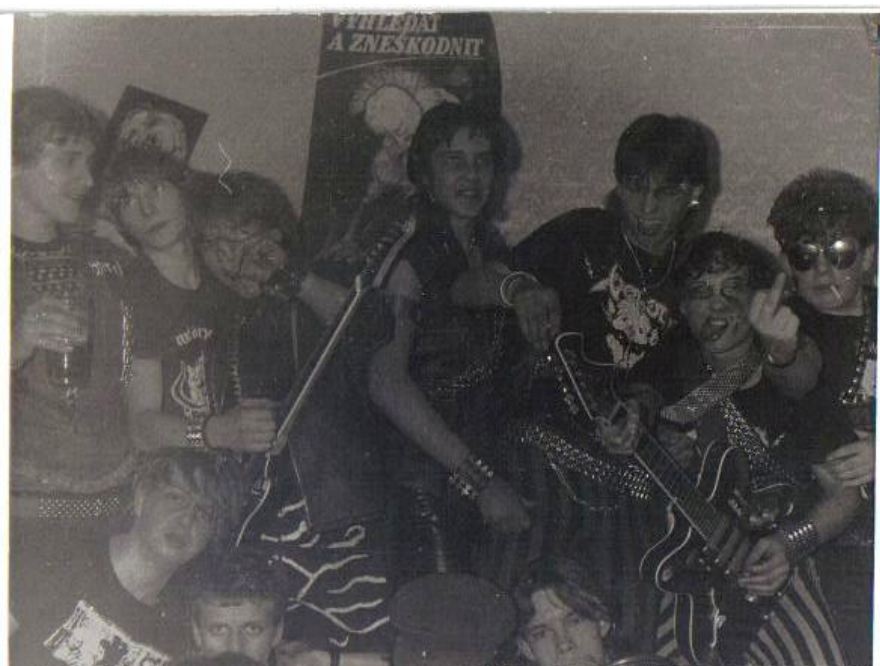
Obr. 3: Čeští punkeři v osmdesátých letech

(zdroj: http://www.punk.cz/index.asp?menu=1852&record=9884 )