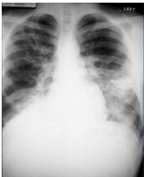
Obr. II: Výškový otok plic