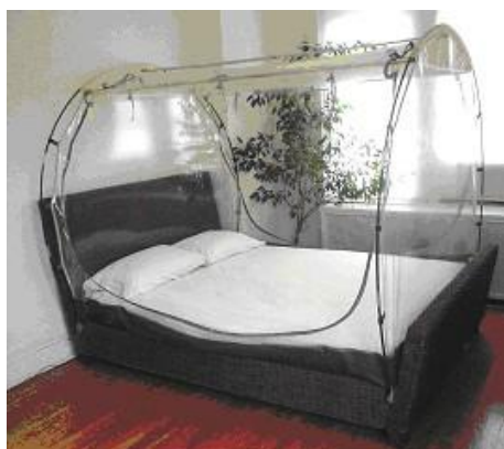
Obr. V: Stan imitující vysokou nadmořskou výšku