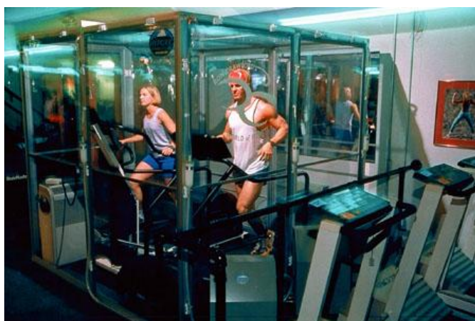
Obr. VI: Hypoxický trénink