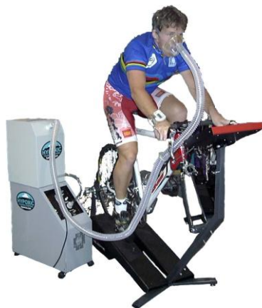
Obr. IV: Vysokohorský tréninkový simulátor