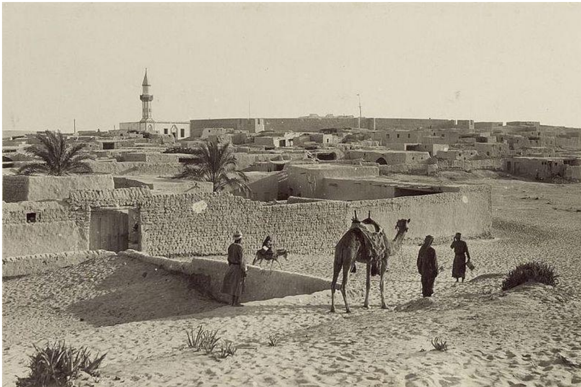
(El-Ariš Sinajský poloostrov,)

Joseph Chamberlain, tehdejší ministr pro kolonie, byl ochotný území El-Ariš na Sinajském poloostrově Herzlovi dát. Zde nemohli Chovevej Cion nic namítat, neboť Sinajský poloostrov byl místo, kde Mojžíš obdržel Boží přikázání a navíc to bylo strategické místo pro vstup do Palestiny. Do El-Ariše byla vyslána komise. Tato komise zjistila, že území El-Ariš je sice liduprázdné, nicméně bez vod, což ho činilo neobyvatelné. A jelikož Egypt odmítl poskytnout vodu z Nilu, nakonec tento plán nebyl uskutečněn. Další pogrom byl roku 1903 v Kišiněvě v Rusku. Anglická vláda nabídla území v Ugandě.