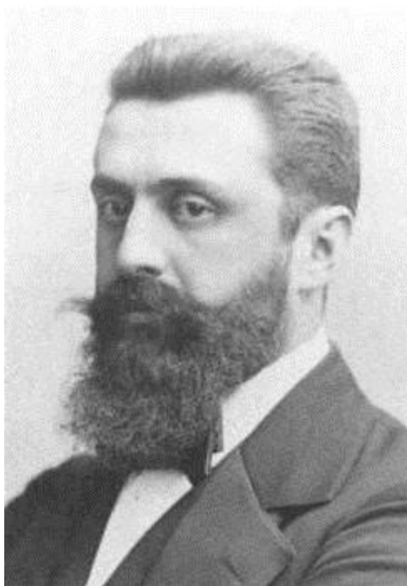
(Theodor Herzl,)

„Dvacet let po rozpadu Bne Moše po vydání Herzlova Židovského státu se sionistické hnutí stalo hnutím světovým, s nímž počítala i mezinárodní politika. V roce 1896 byla tato myšlenka ještě utopií. Mužem, který uskutečnil to, že tato utopie se začala měnit v reálnou skutečnost a dosáhl tak rozhodující změny, byl Theodor Herzl.“ 24