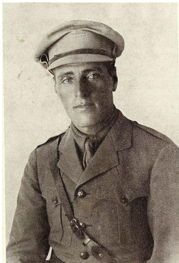
(Josef Trumpeldor, 1880-1920,)

Židovská mládež vytvořila na konci první světové války hnutí, které se nazývalo chalucim (průkopníci) Skupiny mladých z Ruska, Polska, Rumunska a mnoha dalších zemí se rozhodly svůj život obětovat pro výstavbu nové Palestiny. Tito mladí lidé odešli z univerzit, škol a učilišť. Začali se zabývat a vzdělávat v zemědělské činnosti. Zakládali provizorní osady, které nazývali Hachšara („Příprava“). Jejich vůdcem se stal Josef Trumpeldor. Josef Trumpeldor se stal také později velitelem Cion Mule Corps a se Žabotinským 38 organizoval židovskou legii. Tak začala třetí alija .