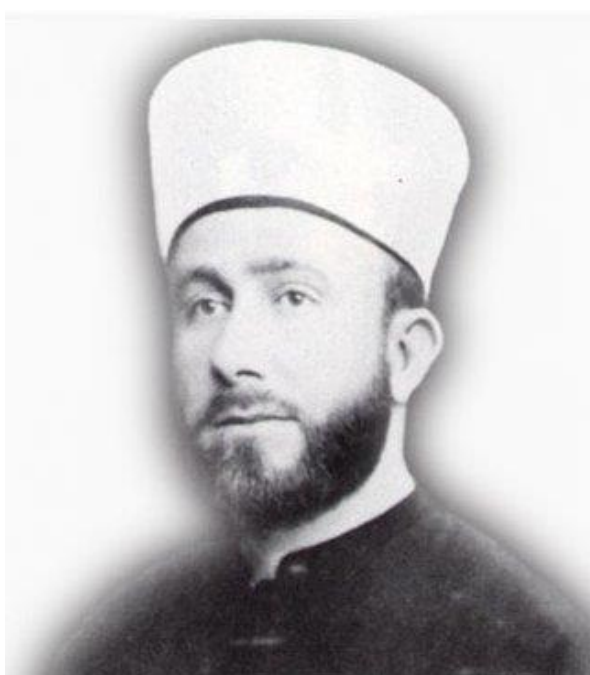
(Hadždž Amín al-Husajní,)

přivírala oči. Roku 1929 vzplály v Palestině boje Arabů proti Židům, ty byly ze začátku motivovány ryze náboženskými pohnutkami. Olej do ohně těchto vzájemných rozepří přilil incident u jeruzalémské Zdi nářků, během týdne zahynulo na 250 lidí. 15. srpna vypuklo protibritské povstání řízené Nejvyšší muslimskou radou v čele s jeruzalémským muftím Muhammadem Amínem al-Husajním. 46 Povstalci žádali zrušení mandátu, nezávislost Palestiny, zrušení Balfourovy deklarace, zastavení židovského přistěhovalectví a zákaz prodeje půdy sionistům. Amín al-Husajní viděl v této situaci velkou příležitost, jak posílit svůj vliv i v politické oblasti. K vyvrcholení událostí došlo ve městech Hebron a Safed, kde se jejich oběti stali především ultraortodoxní Židé. Což bylo paradoxní z hlediska toho, že právě ti se od sionismu distancovali. Avšak když přehlédneme tyto skutečnosti, tak se na rozdíl od okolních arabských států ekonomická a sociální situace arabského obyvatelstva v Palestině zlepšovala.