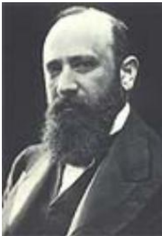
(David Wolffsohn, 1856-1914,)

Po dalších pogromech se probudilo židovské sebevědomí a to spolu s pokračující demokratizací v Rakousku a v Rusku dalo příčinu vzniku židovských stran. Některé strany získaly podporu sionistů, a jiné strany zaujaly antisionistický postoj.