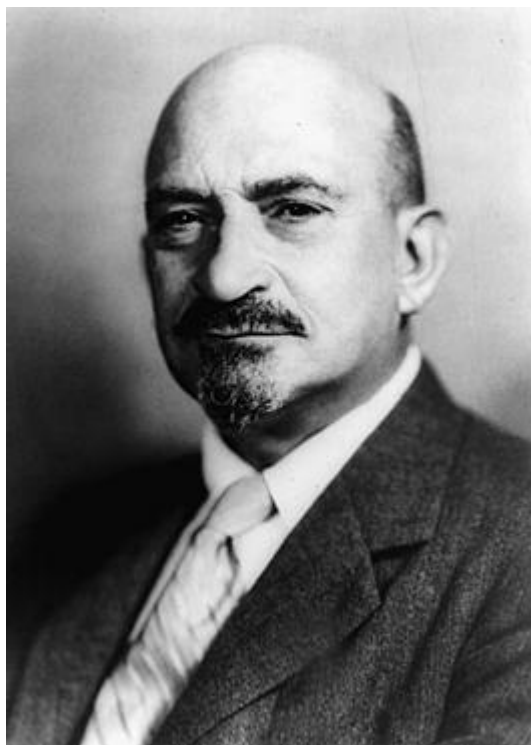
(Chaim Weizmann, 1874-1952,)

Weizmann na předchozí Herzlovu práci. Roku 1906 se stal ministerským předsedou Lloyd George a Arthur Balfour ministrem zahraničních věcí. Oba jmenovaní byli sionismu příznivě nakloněni a už dříve byli přítomni při návrhu Herzlova o získání území v Ugandě pro potřeby Sionistické organizace. Náchumu Sokolovovi se podařilo získat na jaře roku 1916 pro sionismus jednoho z hlavních signatářů anglicko-francouzské smlouvy o rozdělení Turecka a tím byl Mark Sykes. Sykes Sokolovovi zprostředkoval setkání s francouzským kolegou Picotem. Díky tomuto propojení a v neposlední řadě díky podpoře barona Edmunda Rothschilda Sokolov v červnu roku 1917 získal vyjádření solidarity se sionismem ze strany francouzské vlády. Sokolov dosáhl úspěchu i v Itálii a nakonec i u papeže Benedikta XV.. Nemalé přičinění mělo i americké Kongresové hnutí, kde Brandeis získal amerického prezidenta Wilsona, který se pak zasazoval o sionistické požadavky u anglické vlády. Achad Ha-Am, James de Rothschild a Brandeis vypracovali sionistické požadavky a ty pak předali anglické vládě.