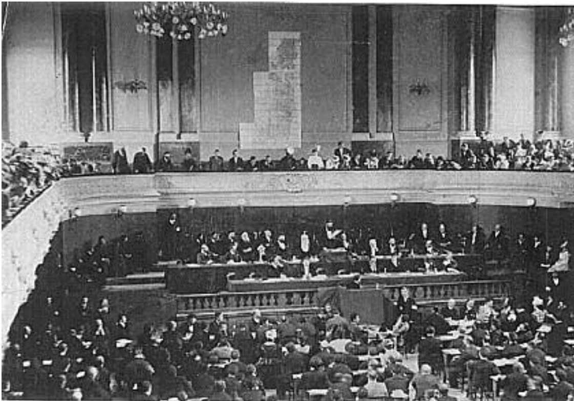
(druhý sionistický kongres)

Prezidentem založené Sionistické organizace se nestal nikdo jiný než Theodor Herzl. Sionistická organizace se sestávala ze zemských organizací, jejímž členem mohl být každý Žid starší osmnácti let. Členové měli platit roční příspěvek, tzv. šekel (podle biblického a talmudického výrazu), který zajišťoval právo volit. Kongres, zvolený ze zemských organizací, se měl scházet každý rok. Po pátém shromáždění nastala změna a rozhodlo se o setkávání vždy po dvou letech. Přípravu kongresu měl na starosti stálý výbor. Herzl požadoval zřízení banky kvůli přípravě dalších organizací a zvednutí tak nákladů s tím spojených. Ta začala fungovat až od roku 1902. Finanční rezervy banky však nebyly totožné s plány Theodora Herzla.