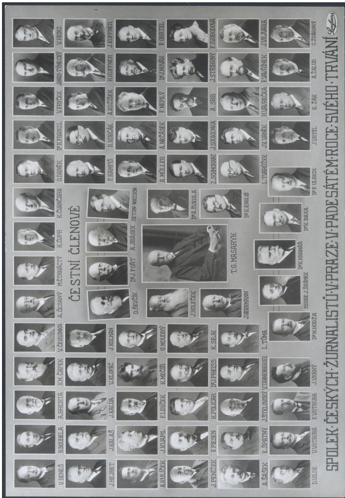
6) Tableau vydané k 50. výročí Spolku českých žurnalistů (1927), Penížkova podbizna je v prvním svislém sloupci na 4. posici).