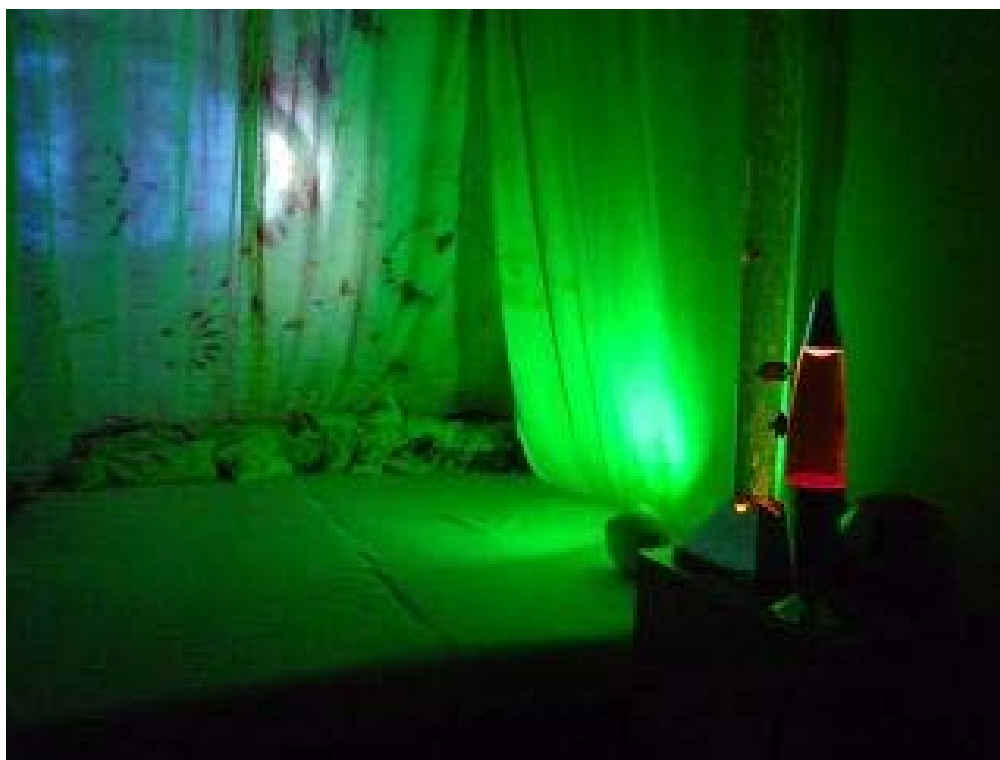
Snímek č. 10 – SNOEZELEN – zelená barva