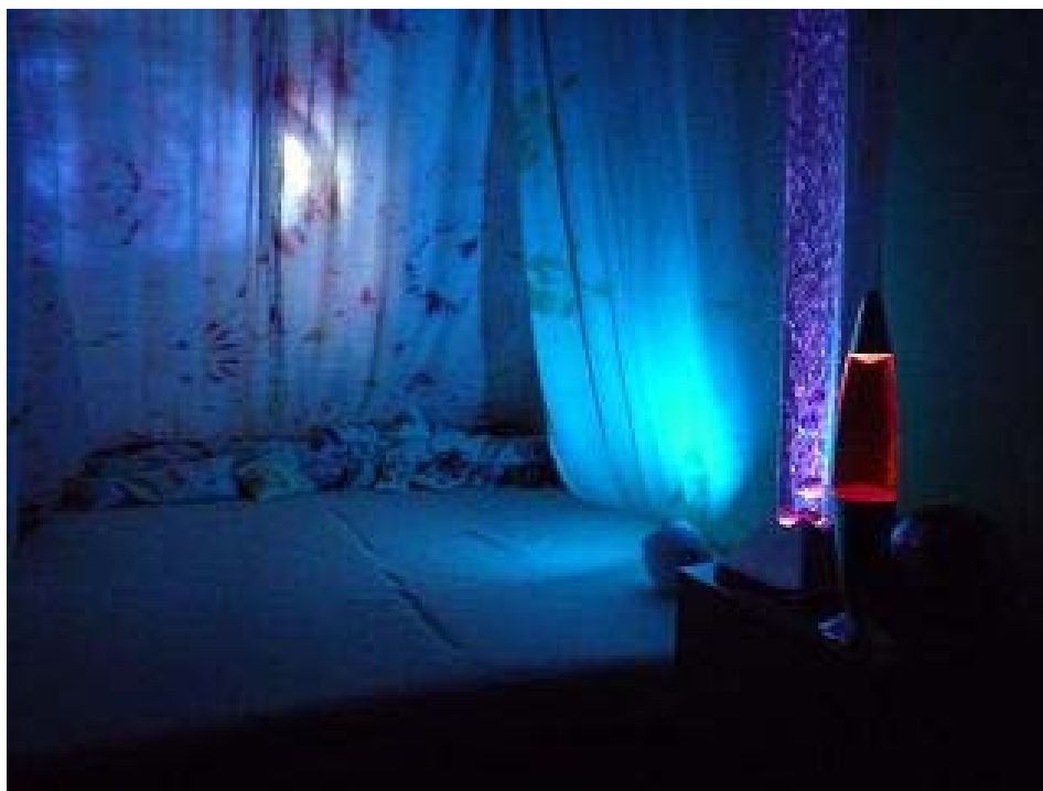
Snímek č. 9 – SNOEZELEN – modrá barva