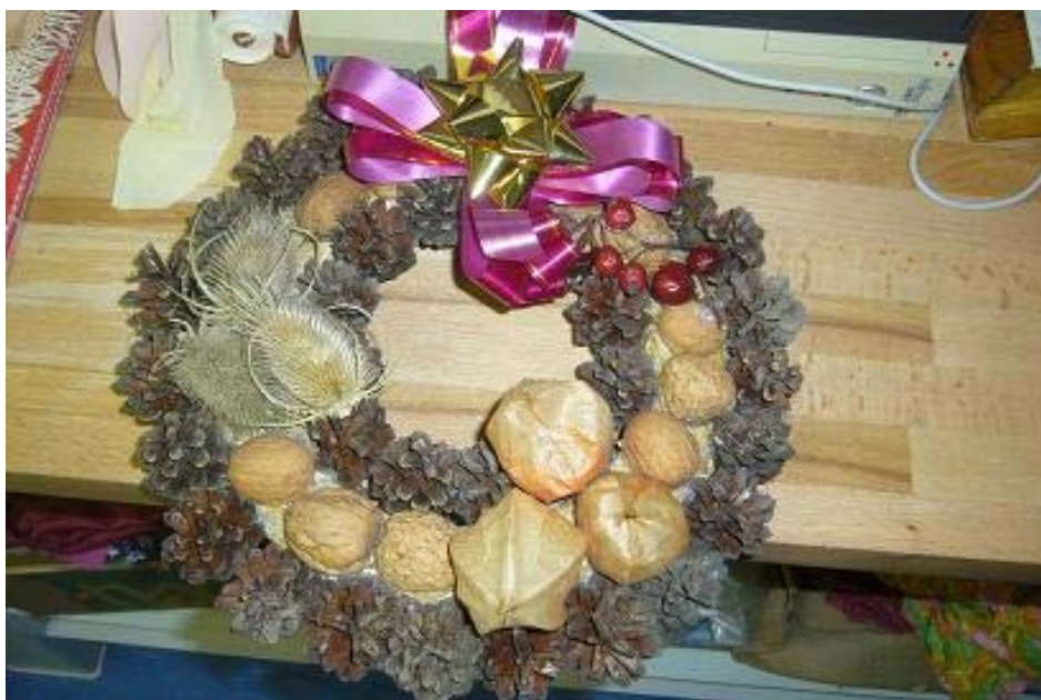
Snímek č.1 - Podzimní věnec na dveře