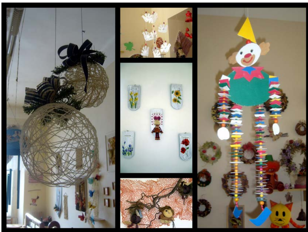
Snímek č.4 – Výrobky v textilním ateliéru Tloskov