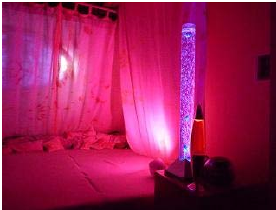
Snímek č. 8 – SNOEZELEN – bílá barva