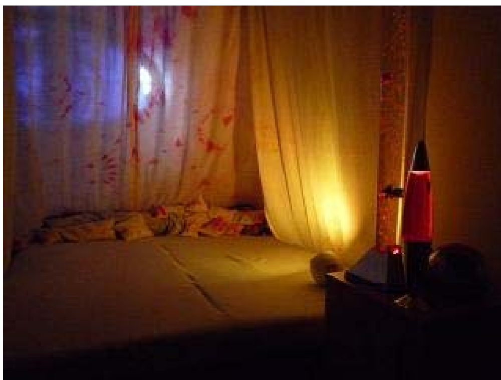
Snímek č. 11 – SNOEZELEN – žlutá barva