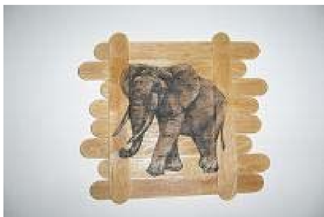
Snímek č.2 - Obrázek na zeď