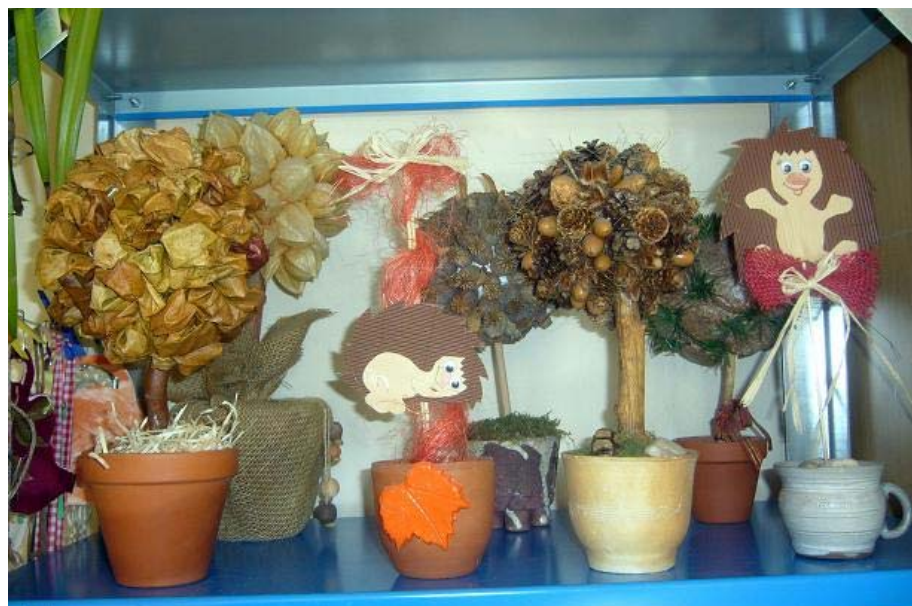
Snímek č.5 – Výrobky v textilním ateliéru Tloskov