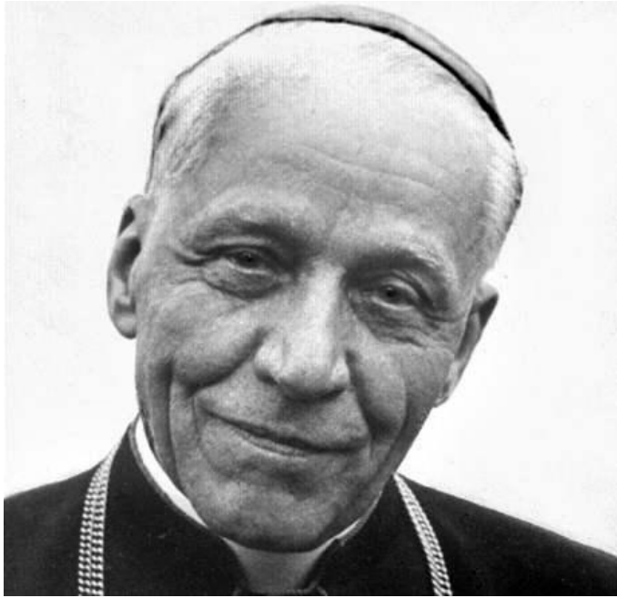
Obrázek 14: Dvě podoby Kardinála Berana. Na komunistické karikatuře 14 a v realitě. 15