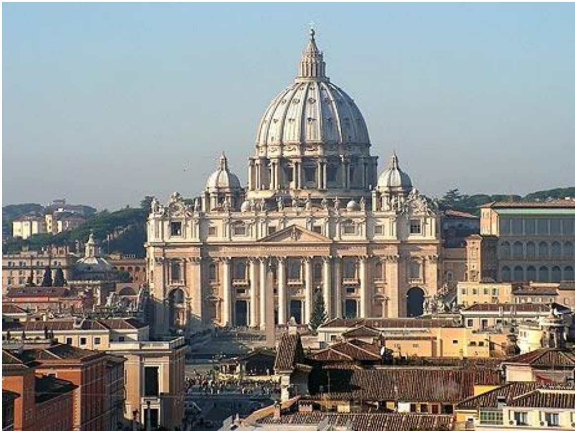
Obrázek 15: Svatopetrská Basilika. Jeden ze symbolů Říma, po staletí cíl českých poutníků a místo spočinutí kardinála Josefa Berana. 16