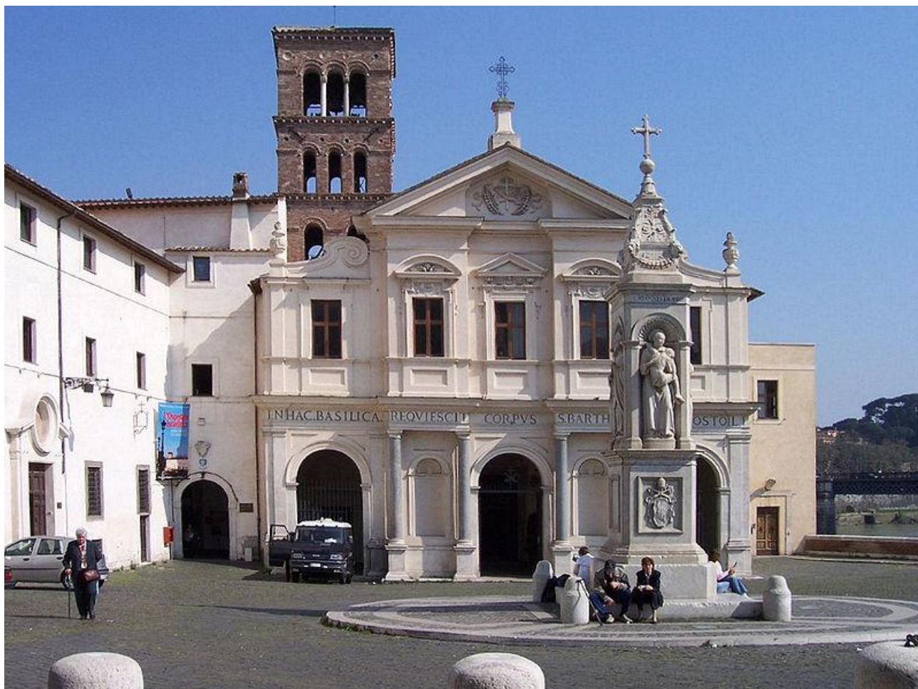
Obrázek 6: Tiberský poloostrov s bazilikou San Bartolomeo, původně zasvěcenou svatému

Vojtěch) a klečícími donátory (vlevo Karel IV., vpravo arcibiskup Jan Očko z Vlašimi).“ 5