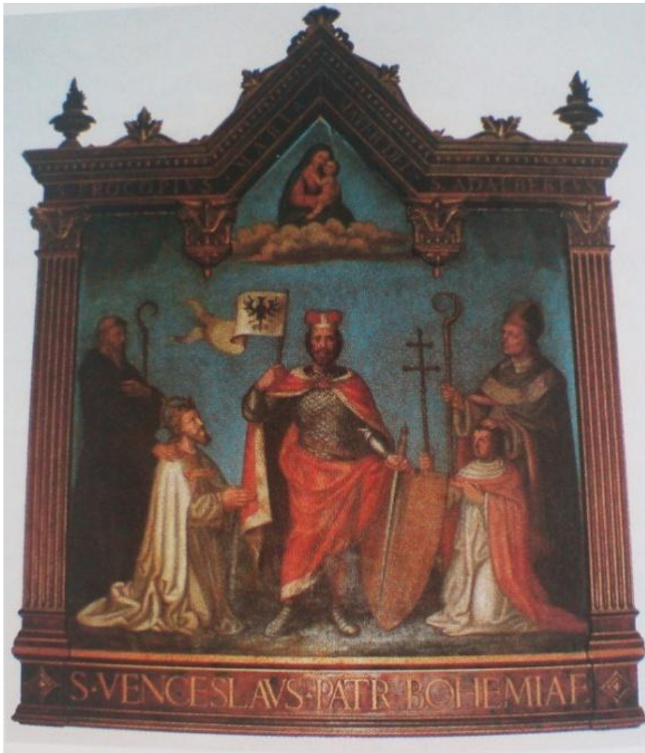
Obrázek 5: Kopie středověkého votivního obrazu „ S. Wenceslaus, patr. Bohemiae , ten byl původně umístěn v bazilice sv. Petra v kapli sv. Václava, představuje Pannu Marii s Ježíškem, českými světci (vlevo sv. Prokop, uprostřed sv. Václav s vévodskou čapkou a orlicí, vpravo sv.