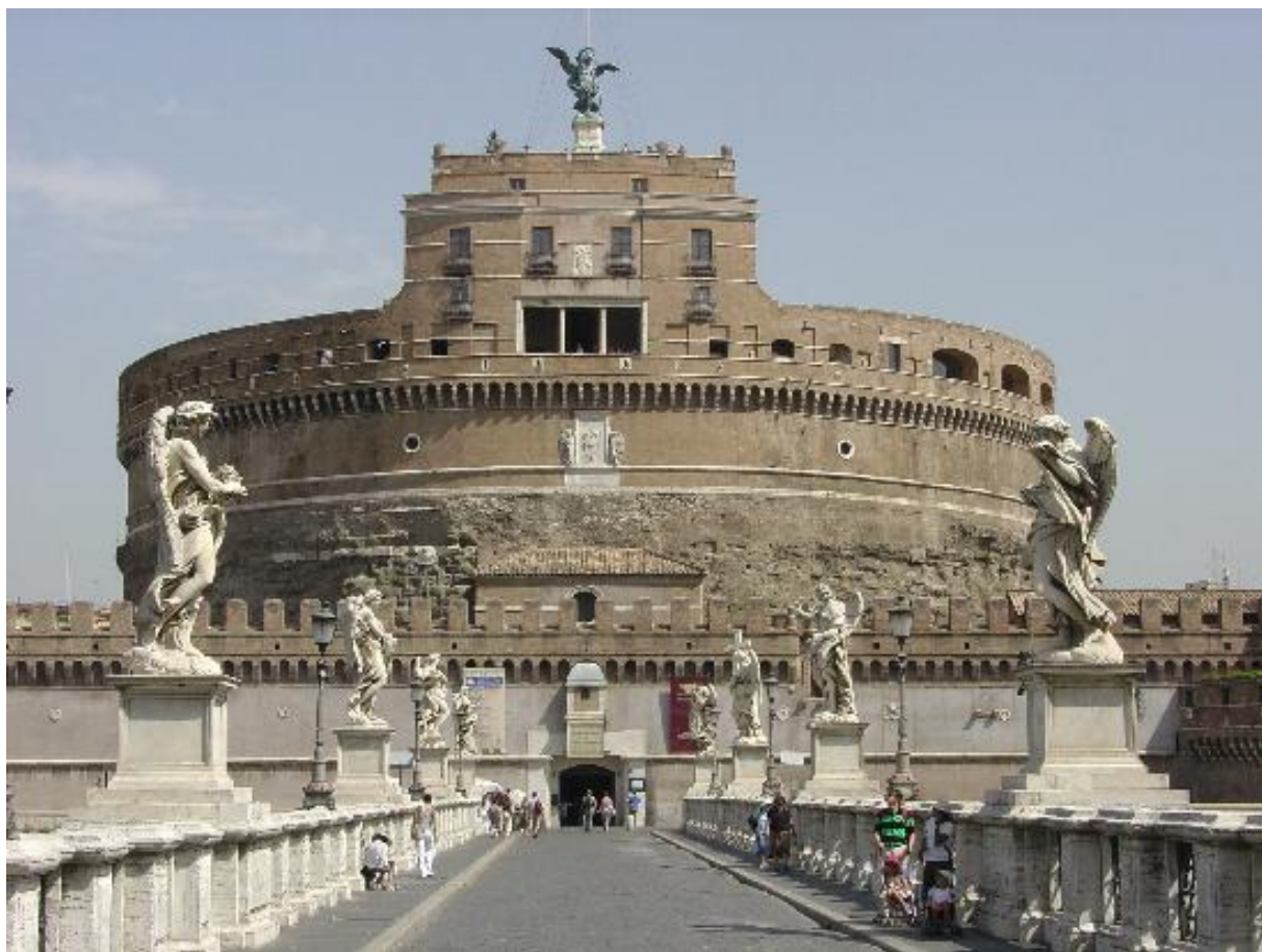
Obrázek 7: Castel Sant' Angelo - původně Hadriánovo mauzoleum, přestavěné pak