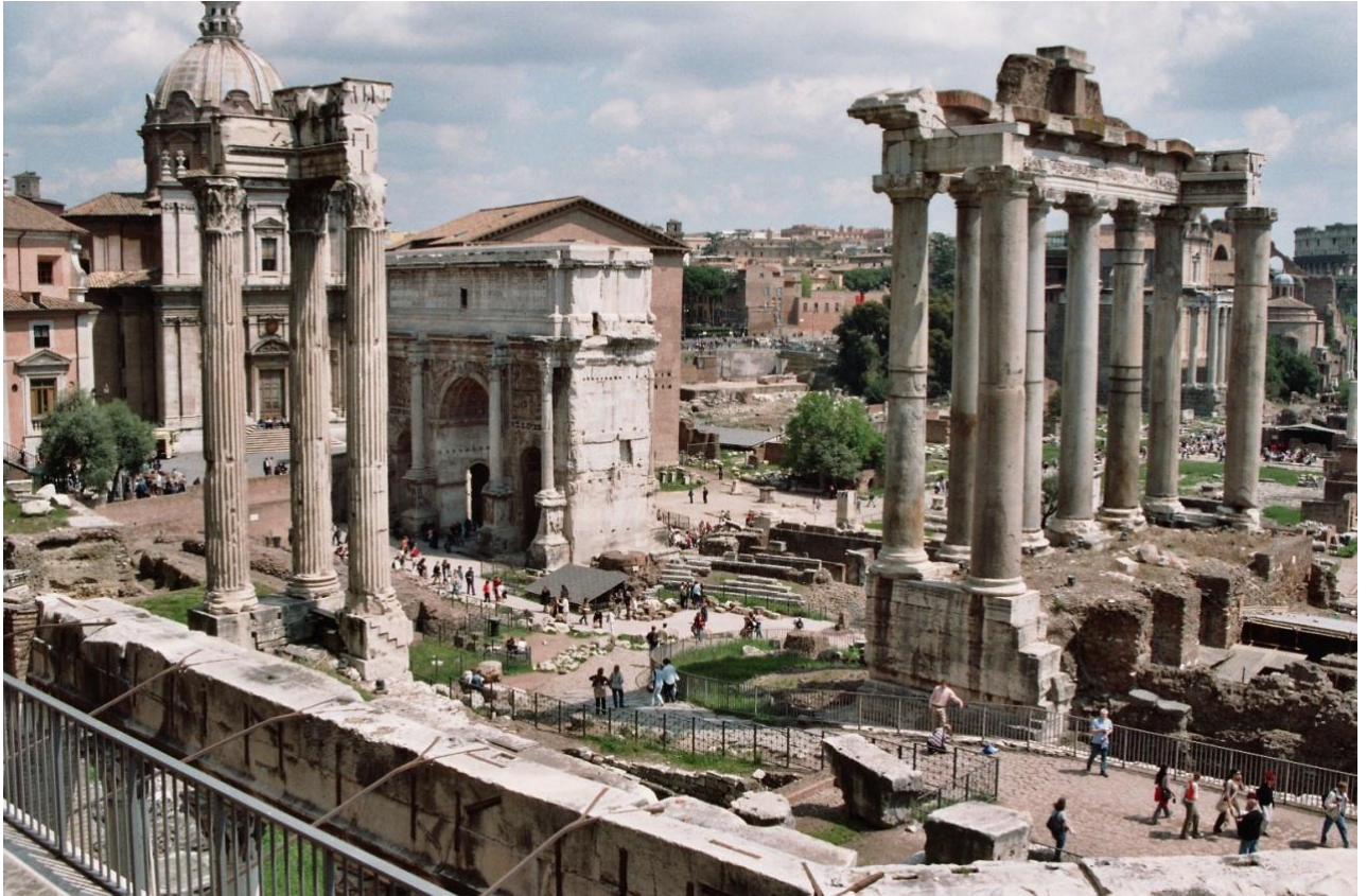
Obrázek 1: Forum romanum. Konec antického impéria neznamenal konec římského vlivu na světové kulturní dějiny, naopak, prostřednictvím křesťanství, ještě zesílil. 1