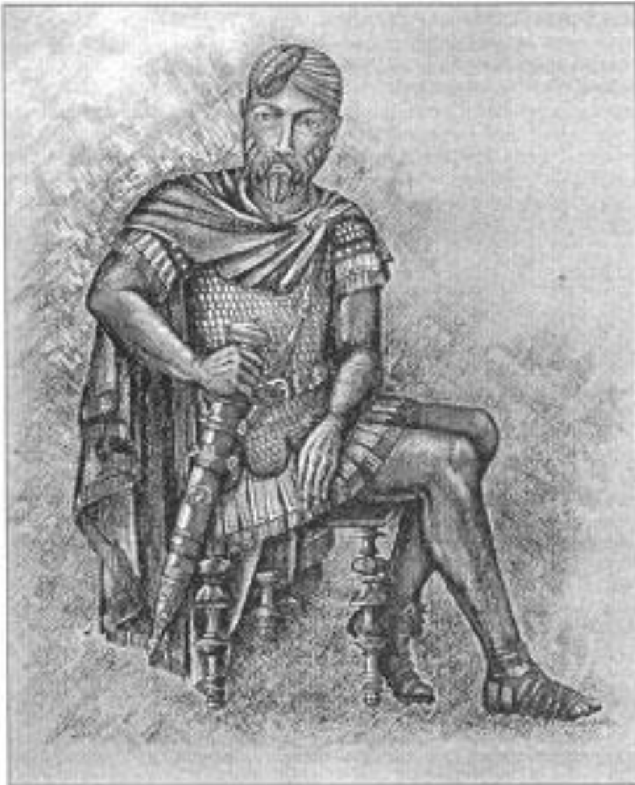
Obrázek 3: Marobud, romantické, idealizované ztvárnění. 3