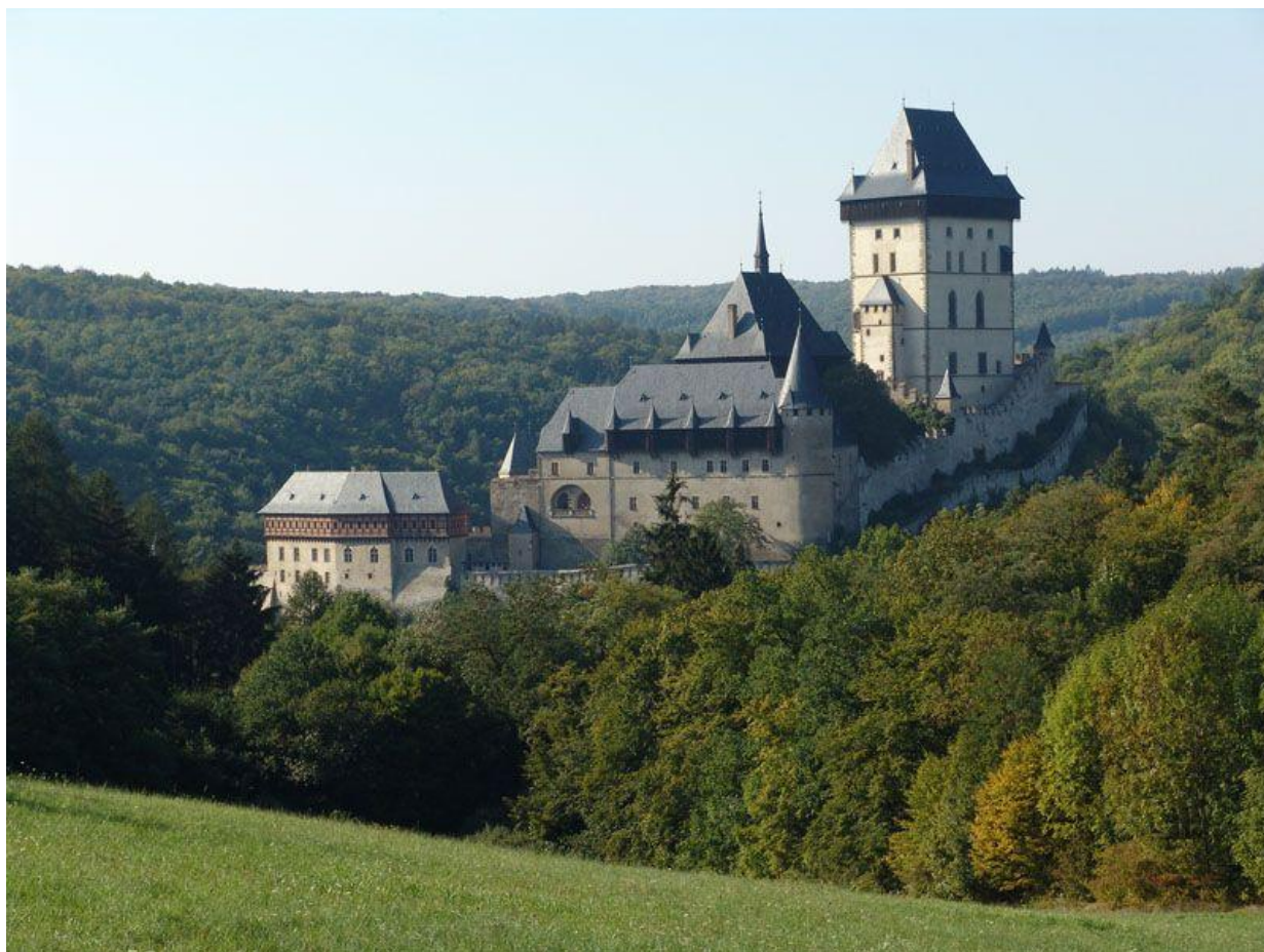
Obrázek 8: Hrad Karlštejn. Představoval opěrný bod panovníkovi moc a důležitý článek

sloužilo jako římská pevnost a úkryt papežů v dobách nepokojů. 7