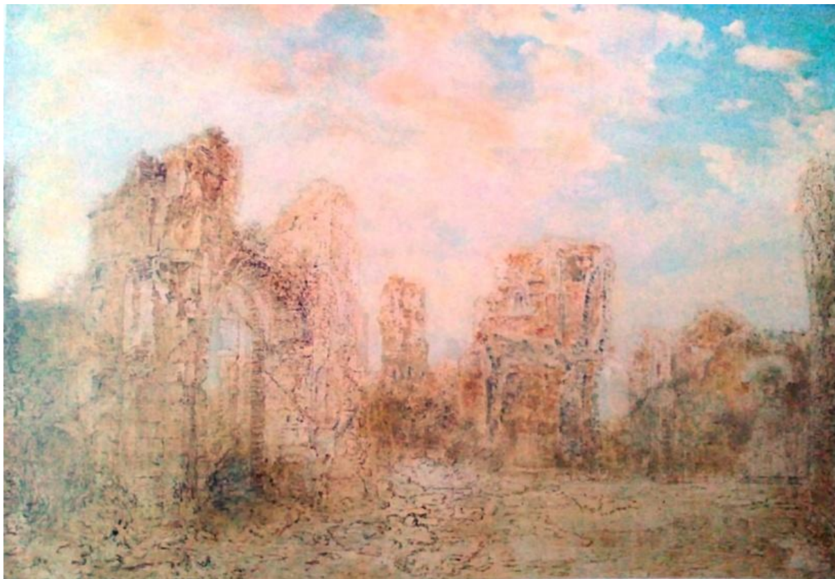
Obrázek 12: Antická krajina v bouři. Václav Mánes. 12