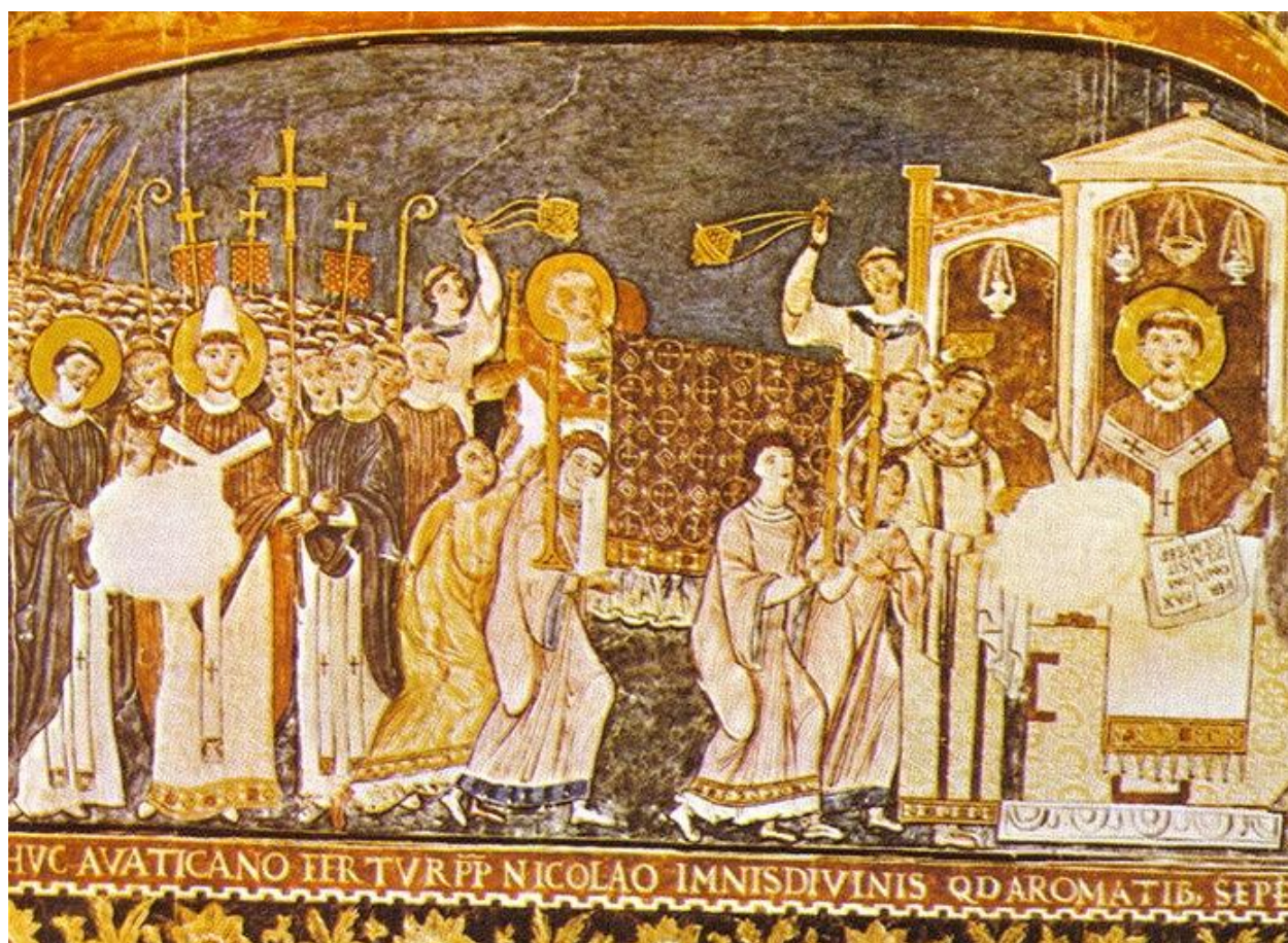
Obrázek 4: Cyrl a Metoděj v Římě. Zpodobnění na fresce v římské bazilice San Clemente.