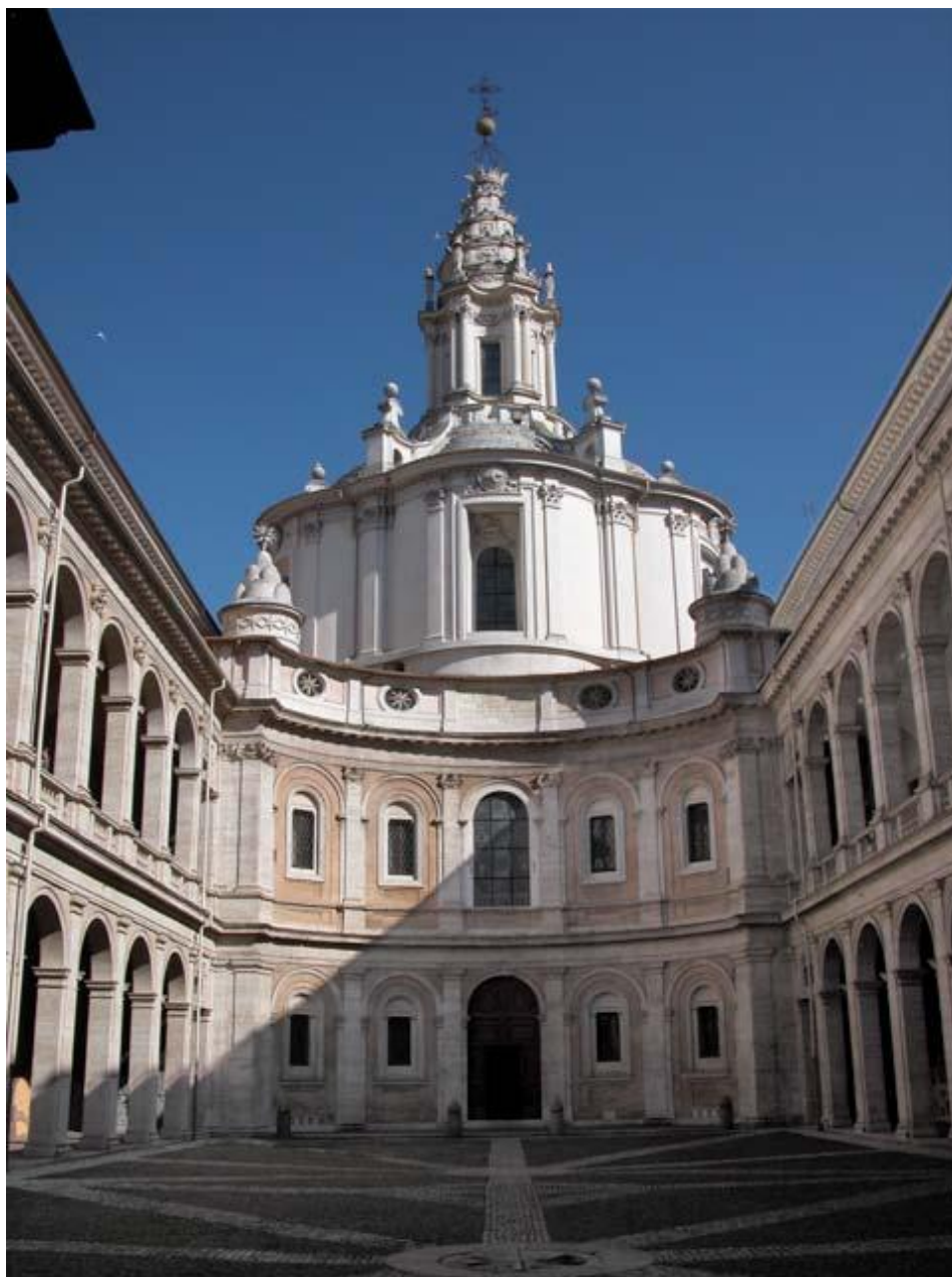
Obrázek 9: Sant Ivo alla Sapienza. Boromini. Krásná ukázka římské barokní architektury,