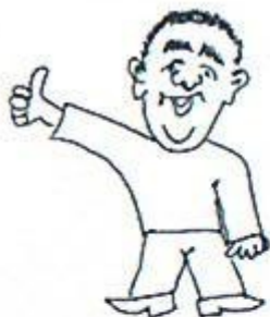
1/ Všechno je v pořádku. Palec nahoru – upaženo.