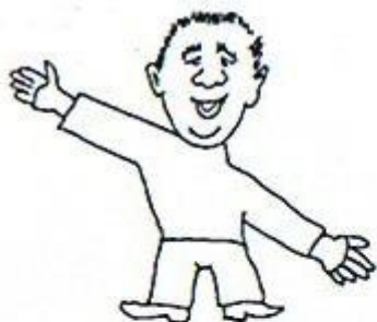
7/ Nepotřebují pomoc, přistání není možné. Paže jsou v diagonále.