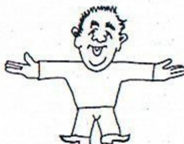
4/ Vznášejte se! Paže rozpažené, dlaně nahoru.