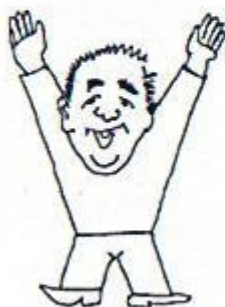
5/ Žádáme o pomoc, je možné přistát. Paže nad hlavou, tělo tvoří »Ye«.