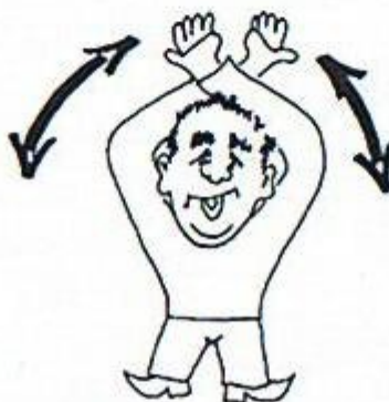
9/ Porucha během pracovního postupu, přerušte pracovní postup! Zkřížené paže nad hlavou.