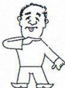
3/ Uvolněte zíváš. Ruka podél brady, druhá podél těla.