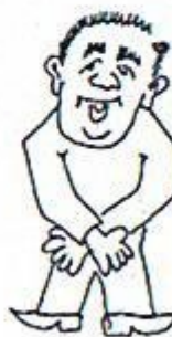
6/ Dokončete přistání. Paže zkřížené před tělem.