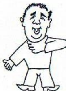
11/ Osoba nebo náklad je připraven. Zápěstí jedné ruky svírá krk.