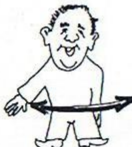
8/ Přerušte přistávací! Náklad odhodte! Natažená paže mává před tělem.