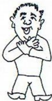
10/ Břemeno nebo náklad je připoután. Ruka svírá druhou v zápěstí.