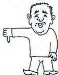
2/ Všechno je špatně. Paže upažena – palec dolů.