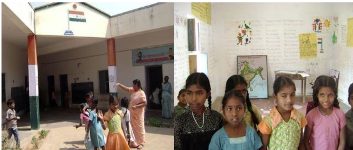
Státní škola v indické vesnici, s 90 dětmi.