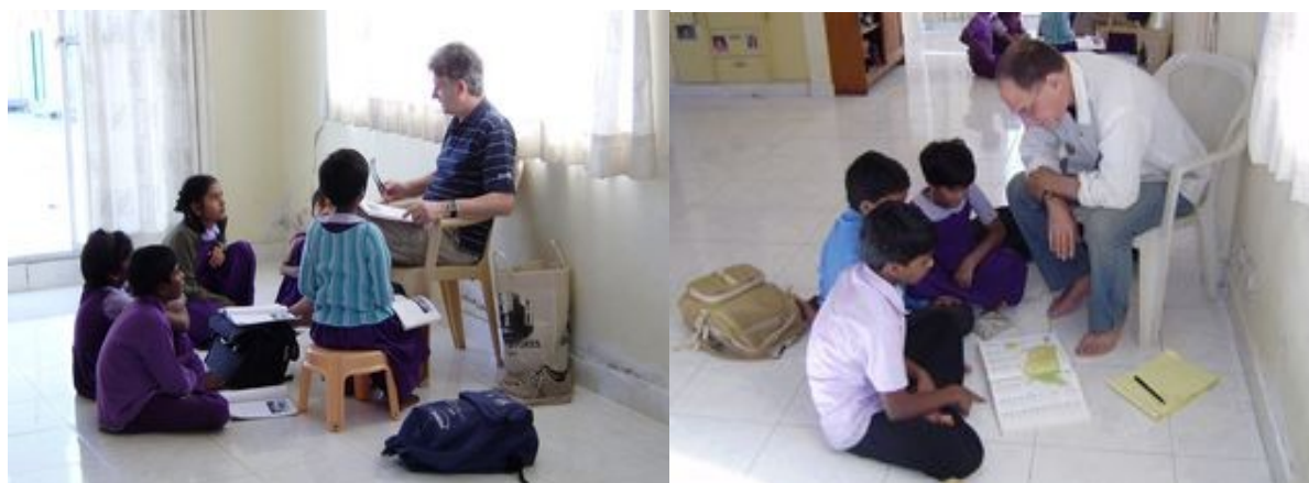
Vyučování dětí z Children's Project Trust.