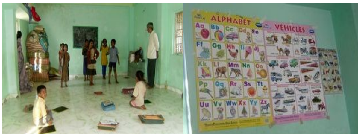
Nestátní škola v indické vesnici, s 28 dětmi, vedená manželským párem.