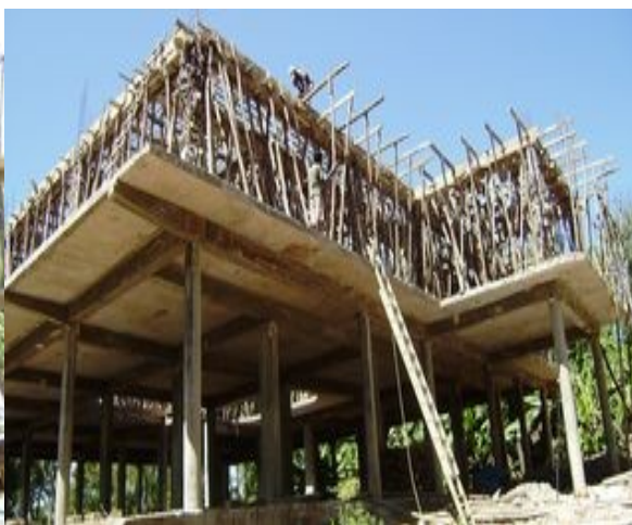
Stavba nového domova a školy Children's Project Trust, pro 120 opuštěných dětí z ulice.