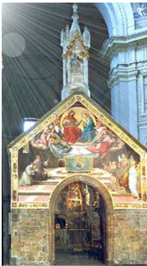
Overback: Freska v kapli v Porciunkule.