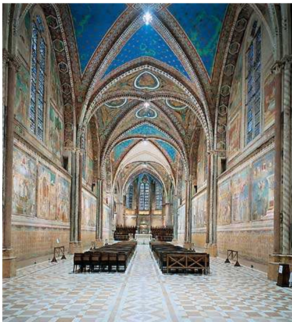
Kostel sv. Františka a sv. Kláry v Assisi.