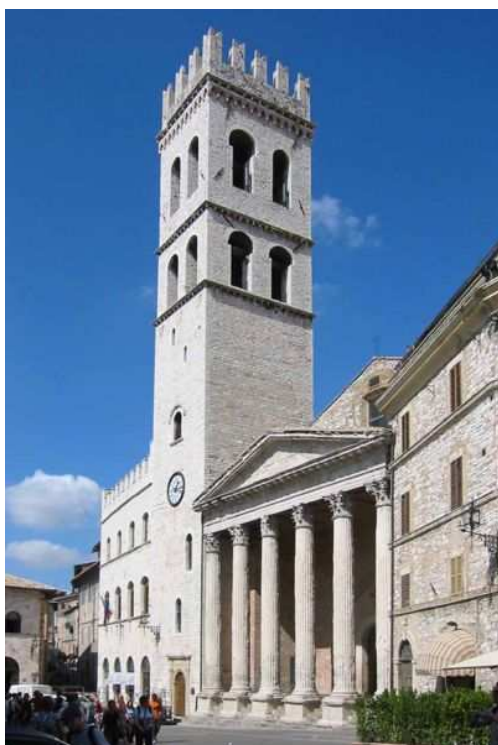
Kostel Santa Maria degli Angeli v Porciunkule.