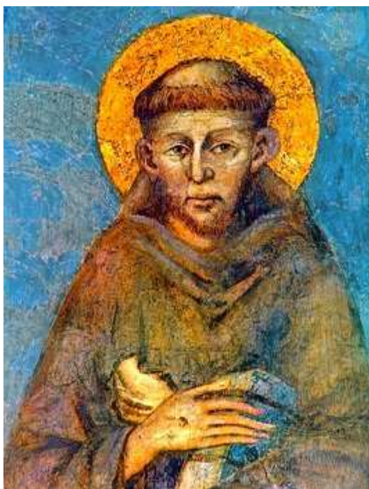
Sv. František z Assisi.