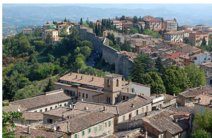
Celkový pohled na Perugii v Umbrii.