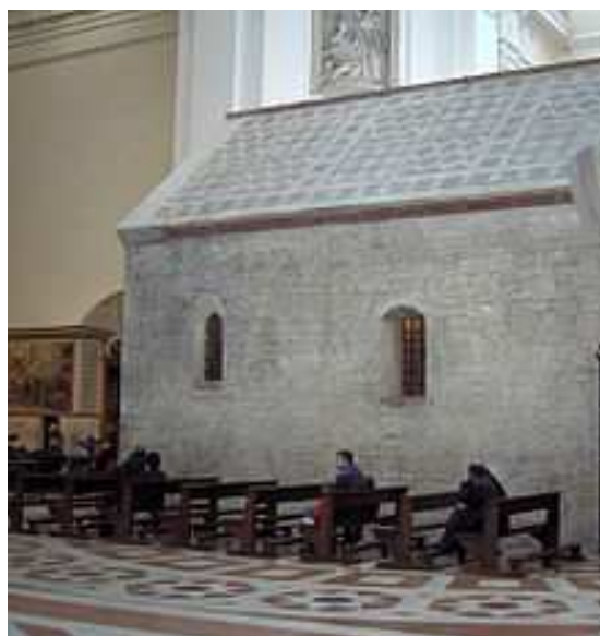
Boční pohled na kapli v Porciunkule.