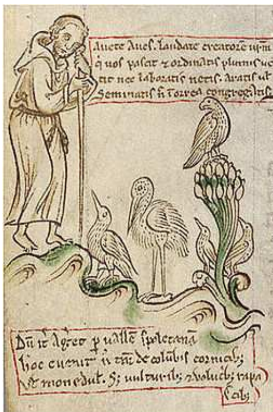
Freska Sv. Františka.