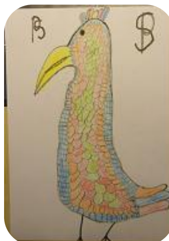
Obr. Papoušek 1