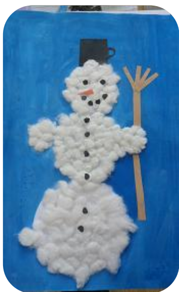
Obr. Sněhulák 1