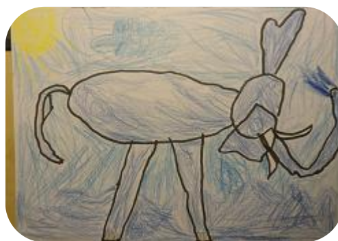
Obr. Slon 2