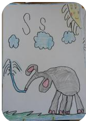
Obr. Slon 1