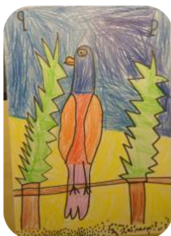
Obr. Papoušek 2