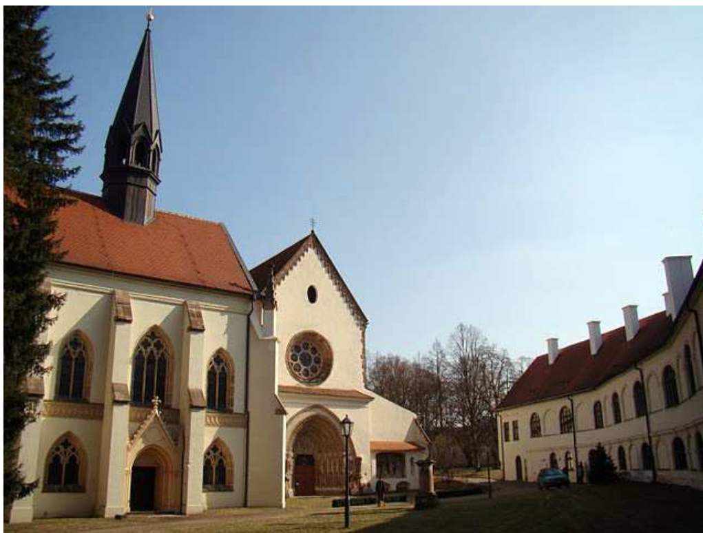
Příloha č.5 Klášter Porta coeli