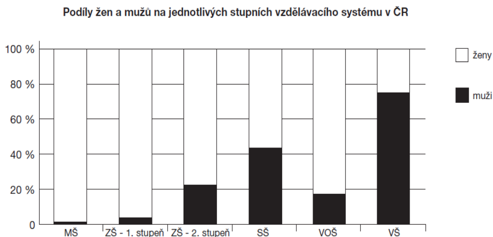
Graf č. 3

Zdroj: Statistická ročenka školství. Výkonové ukazatele (2004/2005).