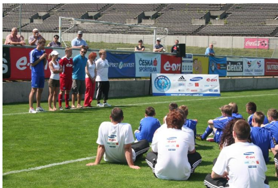
Privítání účastníků Petrem Čechem