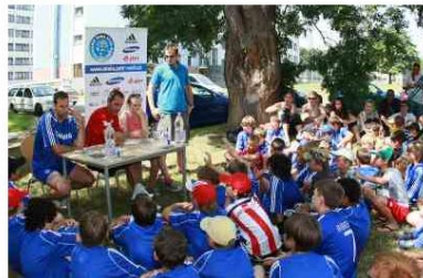
A year ago Cech told Chelseafc.com at length about his project which brings a sporting theme to the long-established Czech tradition of summer activity camps for young people.

'Every year we are gaining more experience, we have improved the organisation, we have improved the service in all aspects and in the last few years we have kept the standard really high, and there are more and more kids coming in so maybe in the future the school will not only be for the summer.'