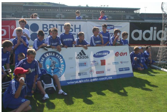
Momentka ze dne s Petrem Čechem