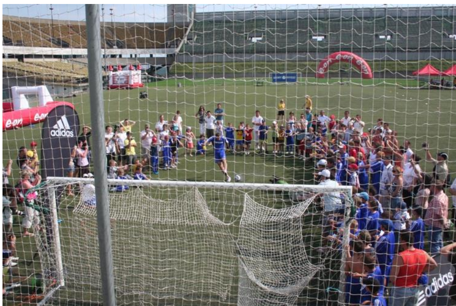
Partnerský den (atrakce firem E.ON a Adidas) – Petr Čech střílí penaltu na rychlost