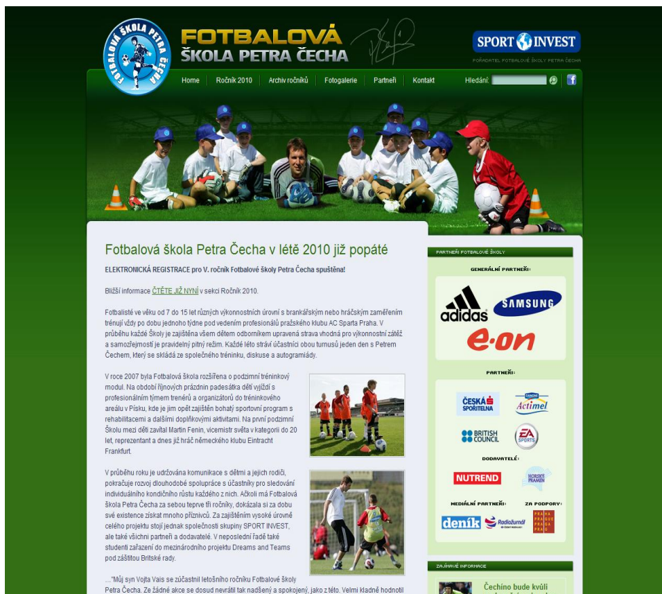
Printscreen webové stránky Fotbalové školy Petra Čecha