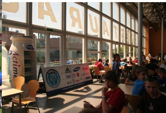
Prezentace partnerů v jídelně