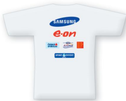
Potisk oblečení instruktorů