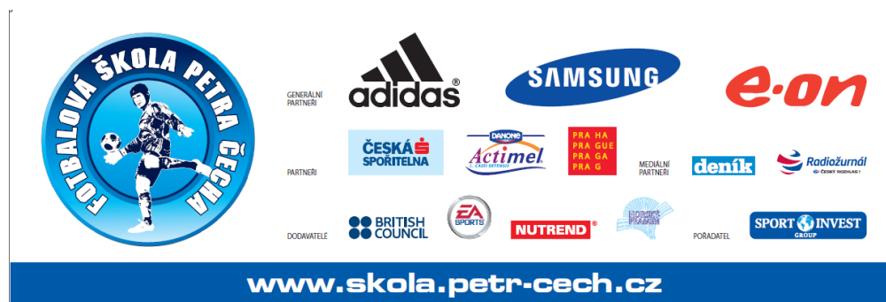
Banner, který byl používán na FŠPČ – přehled všech partnerů