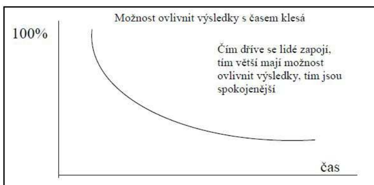
Obrázek 3: Závislost motivace občanů na včasné zapojení do rozhodování.

Autorka uvádí, že je podstatné motivovat veřejnost k aktivní účasti. Je proto, dobré, aby součástí strategických plánů od počátku. Následující obrázek ukazuje závislost motivace občanů a včasným zapojením. Jak uvádí Bauerová, včasné zapojení a krátkodobé cíle jsou významným motivační prvkem v procesu (ibid.).