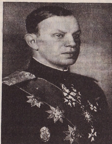
Vůdce N. O. F., zborovský hrdina Radola Gajda, generál r. I.

Již konec dosavadnímu životu, již konec hospodaření politických stran a již konec sedmnáctiletému utrpení ve Vlasti, kterou jsme si krví našich legií a vojsk revolučních vydobyli.