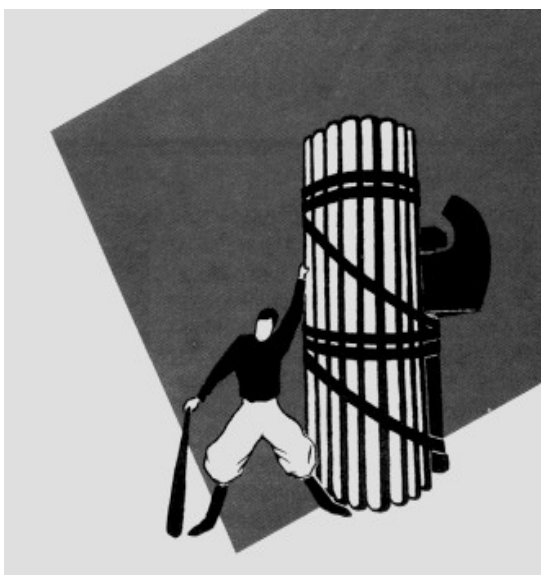
Příloha č. 2: Znak italských fašistů (pro srovnání)