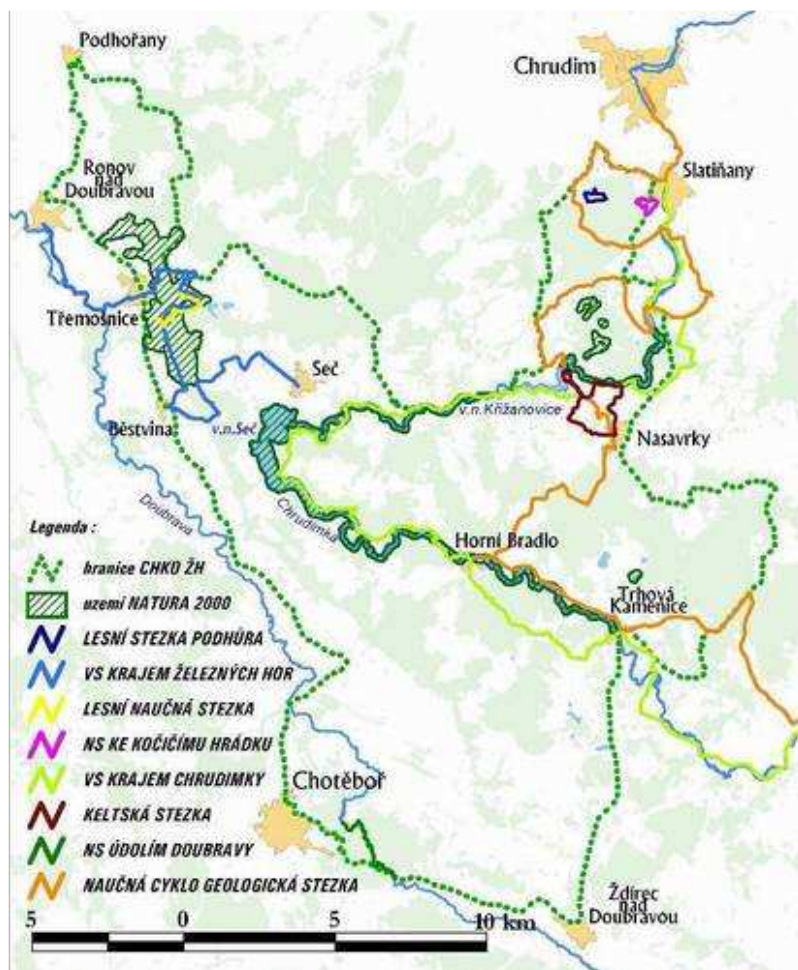
Příloha č. 8: Naučné stezky v CHKO Železné hory