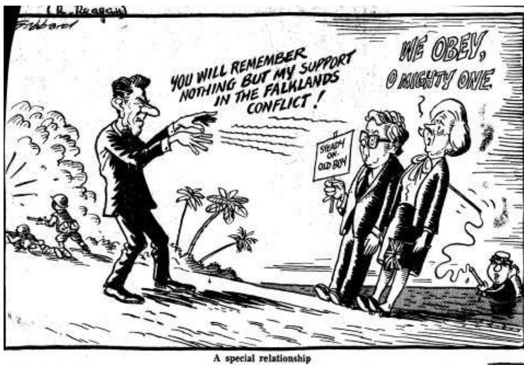
A special relationship