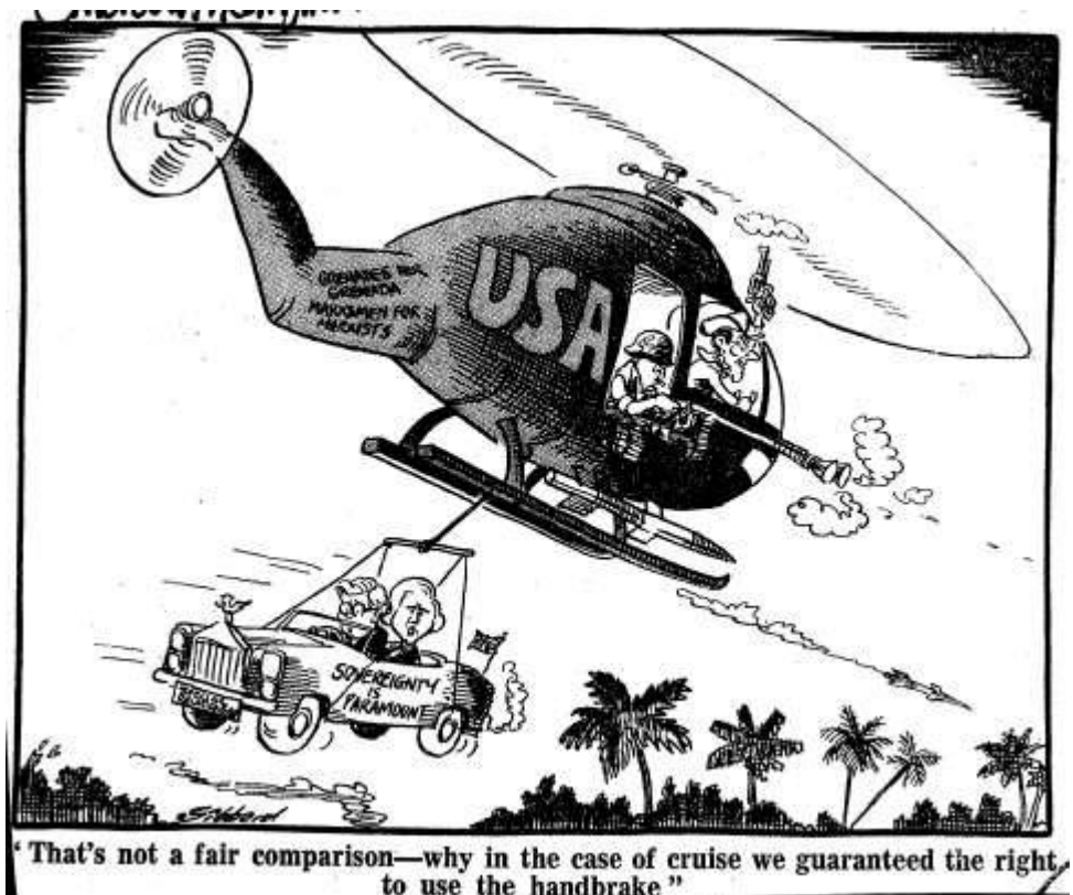
Obrázek 2 The Guardian , October 26, 1983, autor: Leslie Gibbart. 268