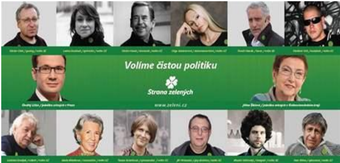
Příloha č. 5 : Volební billboard SZ v parlamentních volbách 2010