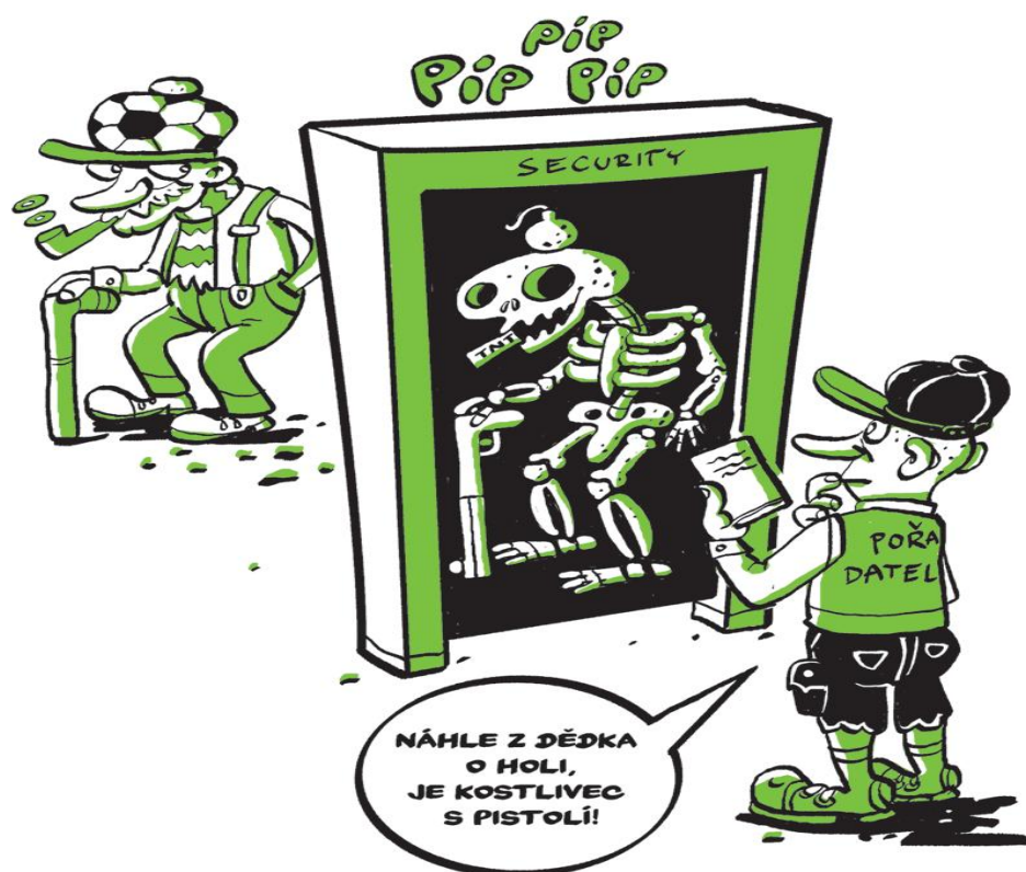
Obrázek č.3 Bezpečí na sportovních utkáních URL 30

Pro všechny pořadatele fotbalových utkání připravilo ministerstvo vnitra České republiky manuál pro fotbalové kluby – Bezpečí na sportovních utkáních. V tomto manuálu se velmi srozumitelným způsobem radí pořadatelům, jak se mají chovat, aby efektivně a účinně předcházeli páchaní diváckého násilí na fotbalových stadionech. Manuál je doprovázen zábavnou ilustrací, která nenásilně upozorňuje na možná nebezpečí.