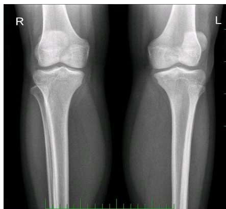
Obrázek č. 1: RTG snímek kolenních kloubů těsně po úraze (12/3/2011) s viditelnou deviací L pately a asymetrií fibulárních kostí