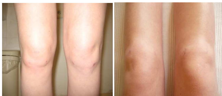
Fotografie č. 5: Pately před terapií Fotografie č. 6: Pately po terapii