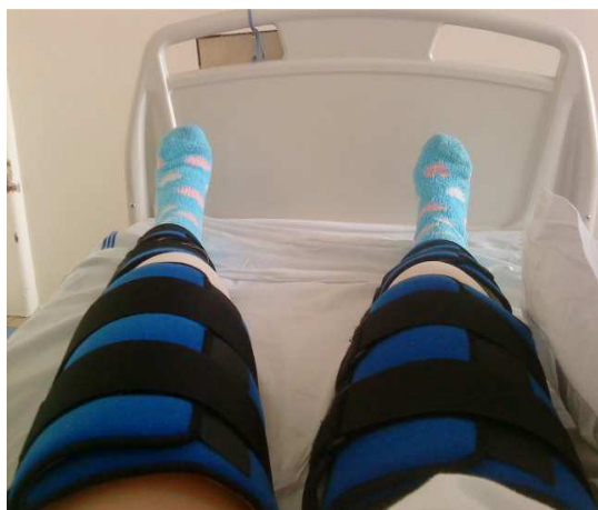
Fotografie č. 7: Rigidní kolenní ortézy