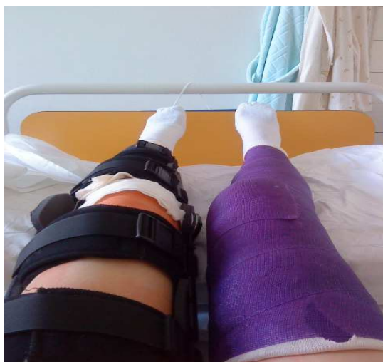
Fotografie č. 8: Kloubová kolenní ortéza na LDK a odlehčená sádrová fixace na PDK