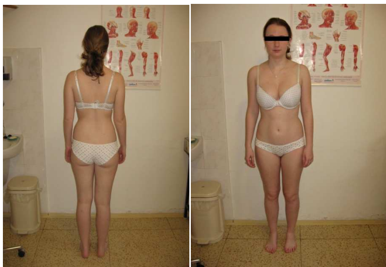
Fotografie č. 1 a 2: Vyšetření stoje aspektů pohledem zezadu a zepředu