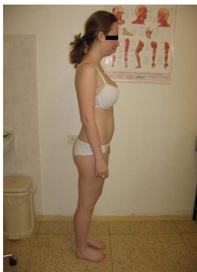
Fotografie č. 3: Vyšetření stoje aspektů pohledem z boku