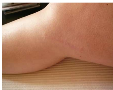
Fotografie č. 4: Jizva po sutuře mediálního kolaterálního vazů na PDK