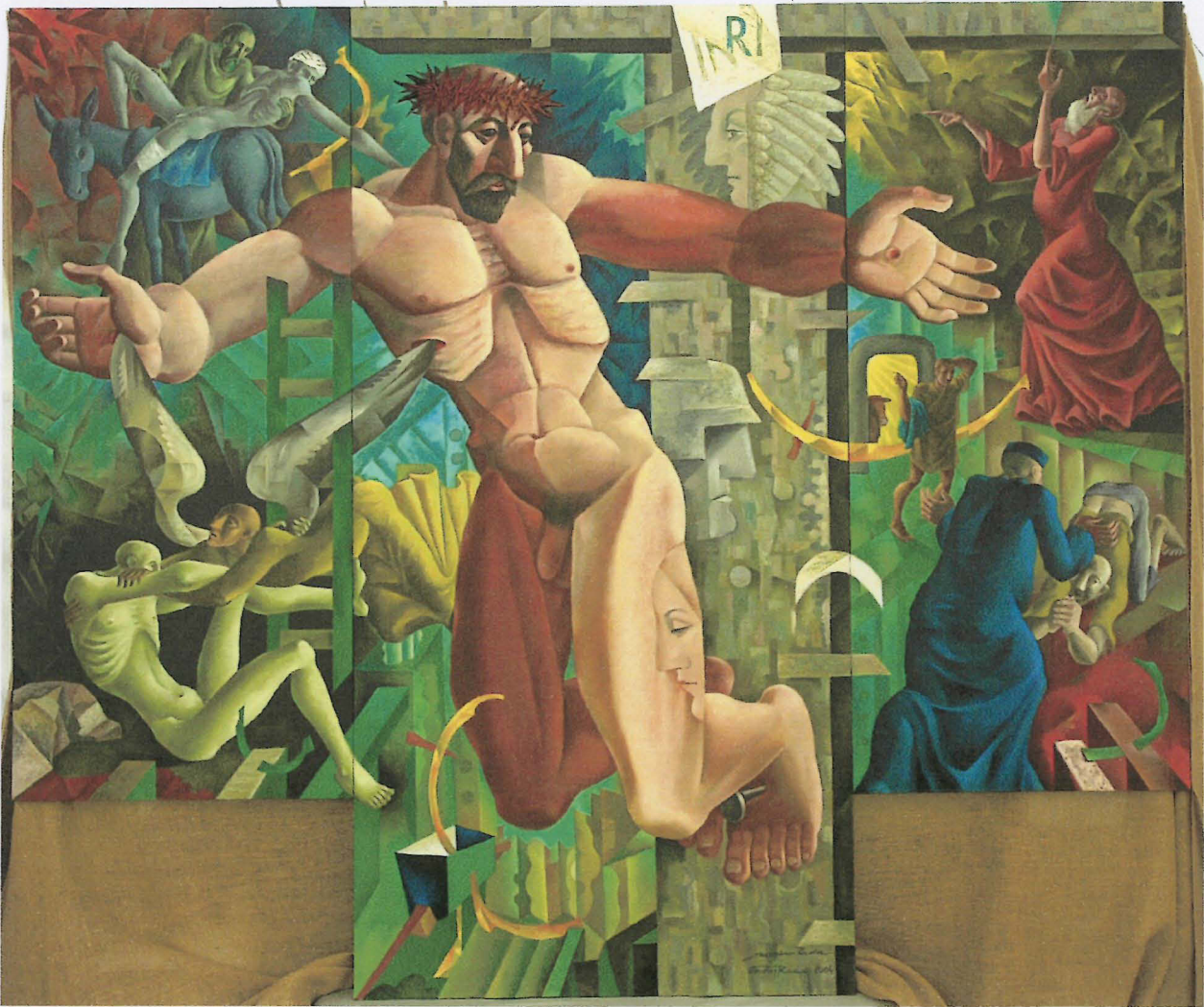
autoři: otec a syn Radovi