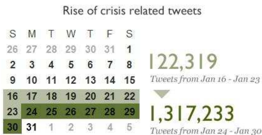
Obrázek 7 – Kalendář tweety za období leden 2011 se slovy Jemen, Tunisko, Egypt

148 uživatelů sledují sami a publikují 3,24 příspěvků za den. Velký počet příspěvků pak tvoří retweety (znovupublikované příspěvky). Analýzou tedy bylo zjištěno, že zdrojem tweetů je zhruba 20 až 30 uživatelů z Egypta. Další tweety jsou pak publikovány dalšími uživateli mimo Egypt. Závěr je tedy takový, že Twitter nemohl prakticky sloužit ke svolávání a organizaci nepokojů. Spíše sloužil jako propagační médium a díky němu bylo možné informovat svět o situaci v Egyptě. V podobném duchu se vyjadřuje i Waddock Doyle na stanici France24 z 10. února 2011 113 . Reportáž vyzdvihuje úlohu sociálních sítí a jejich úlohu v revoluci. Po reportáži z Egypta uvádí informace na pravou míru a upozorňuje, že přes sociální sítě bylo možné publikovat a šířit informace o dění v Egyptě. Ukládání fotografií a videí pomáhalo informovat svět.