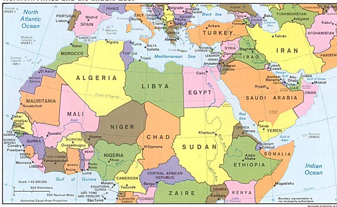
Obrázek 5 - Severní Afrika a Střední východ

http://www.lib.utexas.edu/maps/middle_east_and_asia/n_africa_mid_east_pol_95.jpg