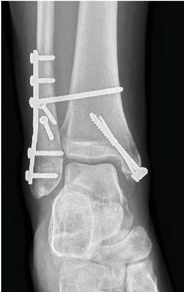
Příloha 1: RTG snímky po osteosyntéze hlezenního kloubu