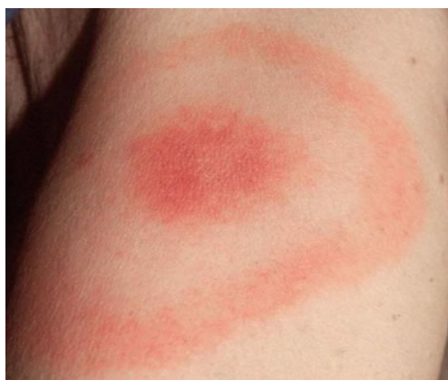
Obrázok 4: Erythema migrans