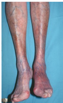
Obrázok 5: Acrodermatitis chronica atrophicans na dolných končatinách