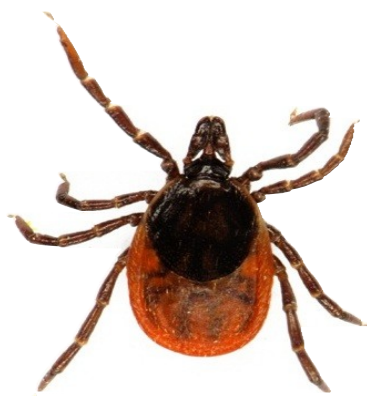
Obrázok 2: Ixodes ricinus – Kliešť obyčajný

I. ricinus je hlavným vektorom troch pre človeka preukázane patogénnych druhov – B. burgdorferi sensu stricto, B. garinii a B. afzelii v Európe. Štúdie poukazujú na rozdielnu prevalenciu jednotlivých druhov borrelií u rôznych hostiteľov [8, 20].