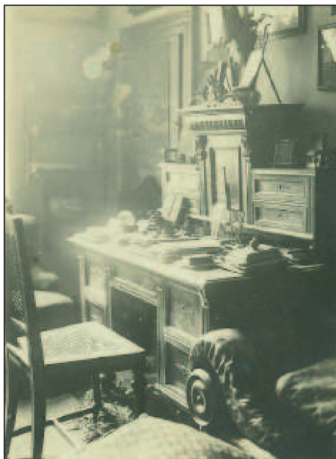
15. Psací stůl Vlasty Pittnerové v bytě na Vinohradech