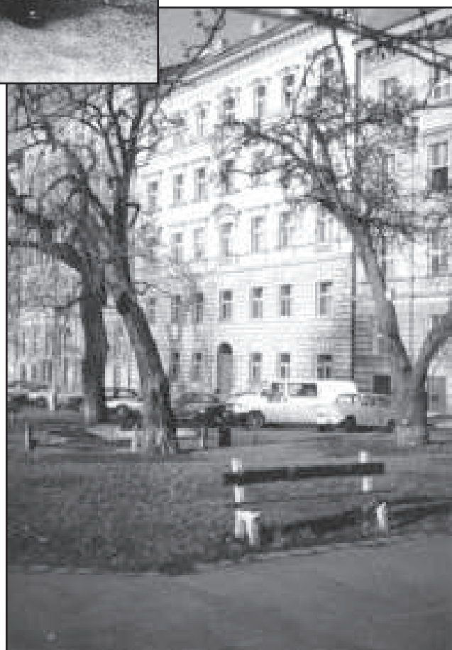
7. Pohled do ulice U železné lávky a dům čp. 557/6, kde bydlely Anna a Eliška Řehákové