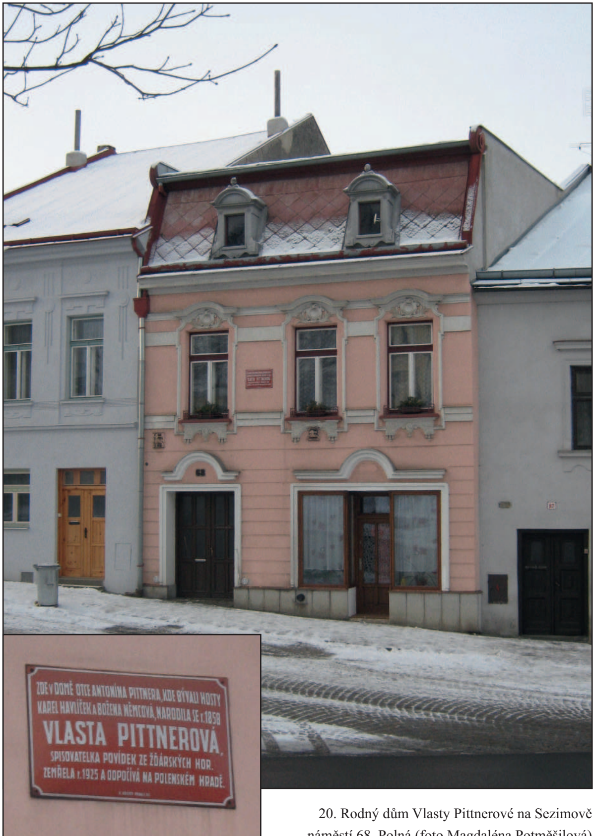
20. Rodný dům Vlasty Pittnerové na Sezimově náměstí 68, Polná