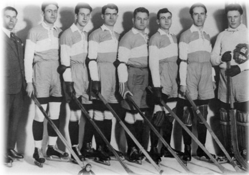
Obrázek 1: HOSK Kladno 1927-1928