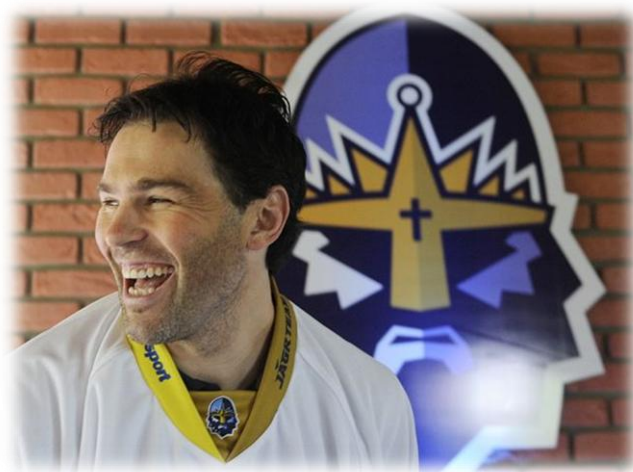
Obrázek 12: J. Jágr vlastník klubu HC Rytíři Kladno