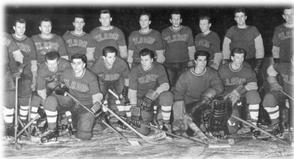
Obrázek 3: TJ SONP Kladno 1960-1961