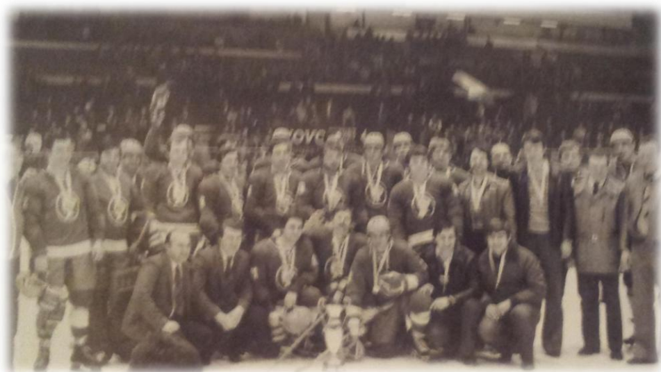
POLDI SONP Kladno A- mužstvo, mistr republiky 1979-1980