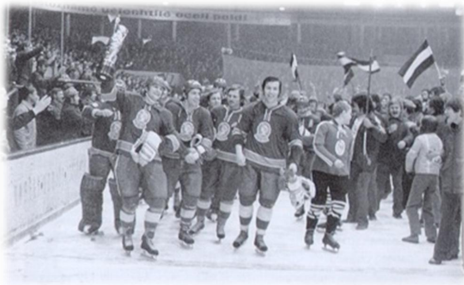
Obrázek 5: Radost kladenských hráčů po utkání se Spartou (6:1) v roce 1976