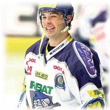
Obrázek 13: J. Jágr v roce 2004 při výluce v NHL opět vypomáhal Kladnu