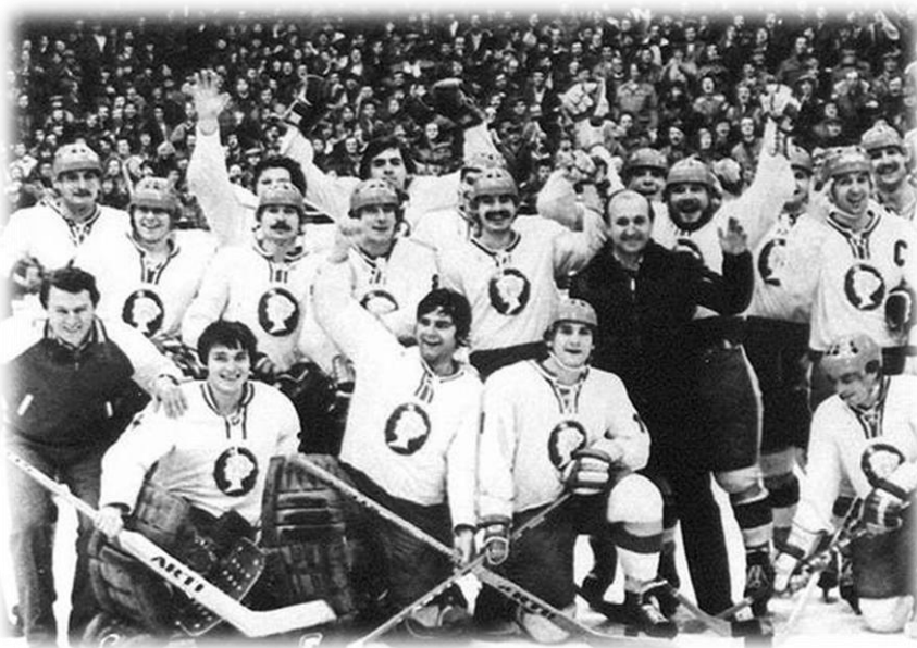
Obrázek 6: Mistr ligy 1980