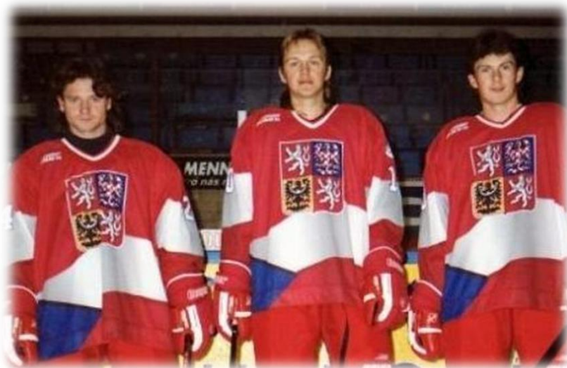
Obrázek 14: Paterovci v reprezentaci v roce 1996