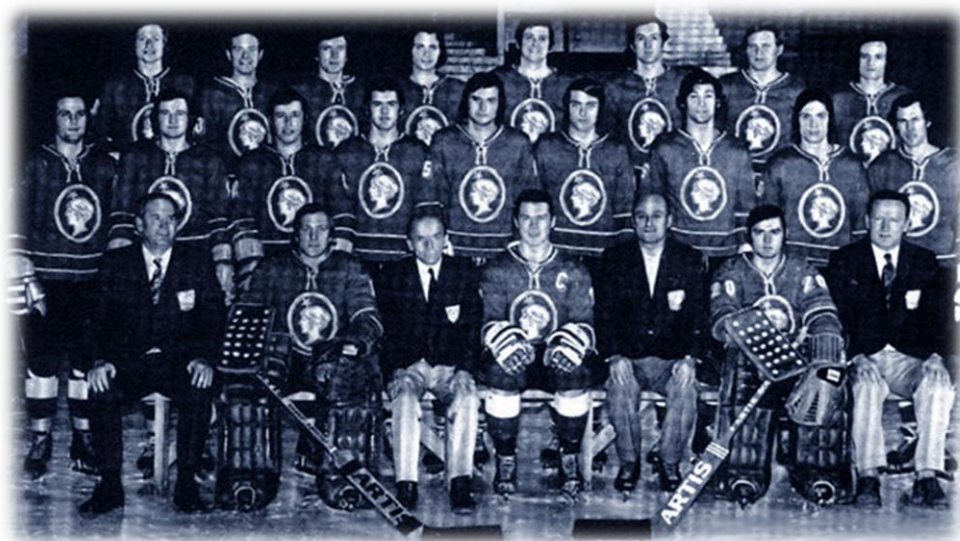
SONP Kladno A- mužstvo, mistr republiky 1974-1975