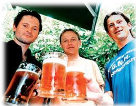
Obrázek 15: Staří kamarádi v kladenské hospodě