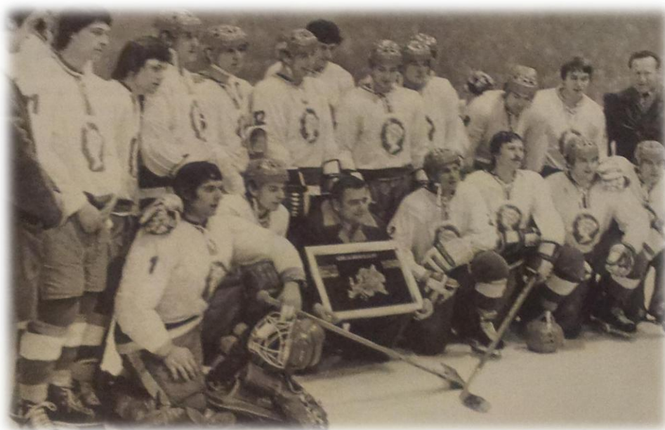
POLDI SONP Kladno A- mužstvo, vítězové PMEZ 1978-1979