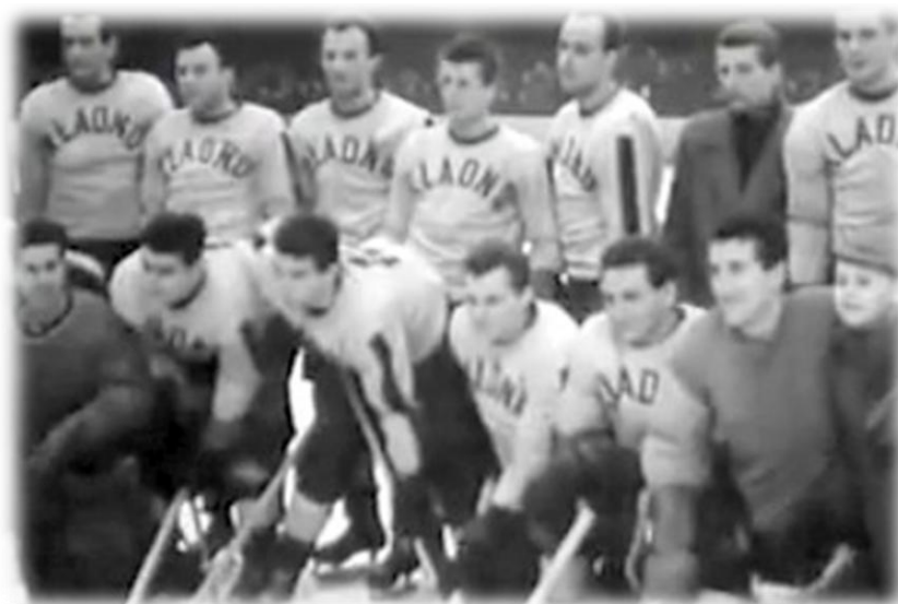
Obrázek 2: SONP Kladno, mistři republiky