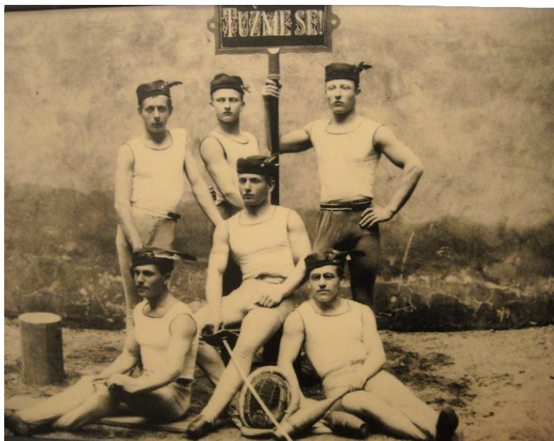
Obr. 1 – Sokolové 37