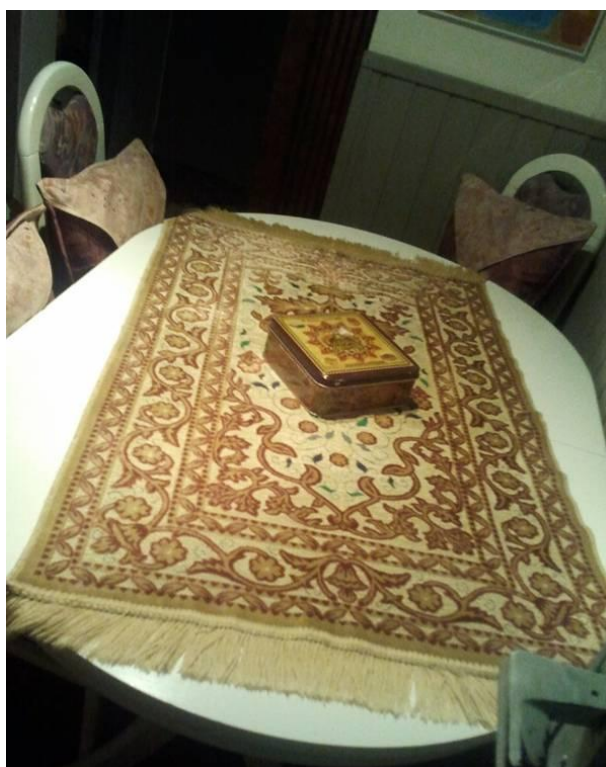
Obrázek 4 1