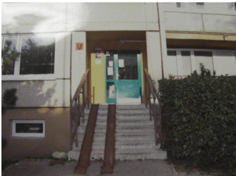
Obrázek č. 1 – Místo konání rekonstrukce trestného činu (zároveň se jedná o místo činu)