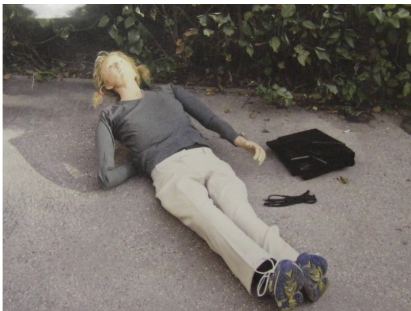
Obrázek č. 2 – Pomůcky použité při rekonstrukci (figurína ženy, tkanička a černá plachta)