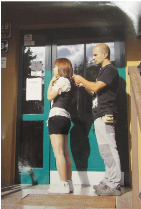
Obrázek č. 5 – Figurant na základě instrukcí poškozené předvádí, jak dal obviněný poškozené šňůrku kolem krku