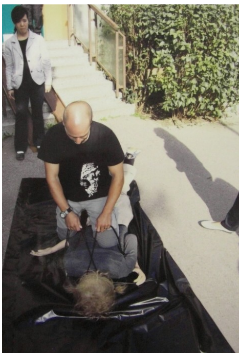
Obrázek č. 7 – Figurant na základě instrukcí poškozené předvádí, jak ji obviněný škrtil po pádu ze schodů