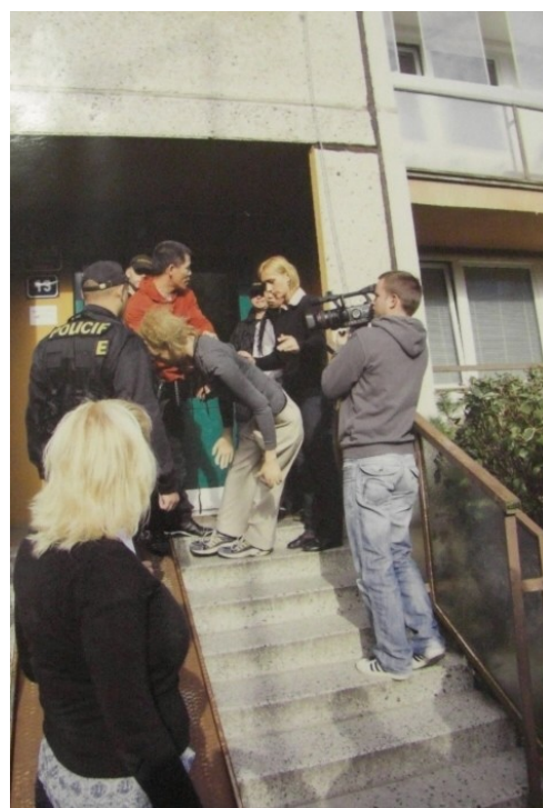
Obrázek č. 4 – Obviněný ukazuje na figuríně, jak poškozená padala ze schodů