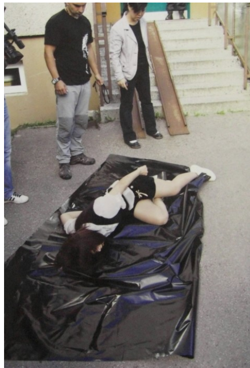
Obrázek č. 6 – Poškozená předvádí, v jaké pozici skončila poté, co spadla ze schodů