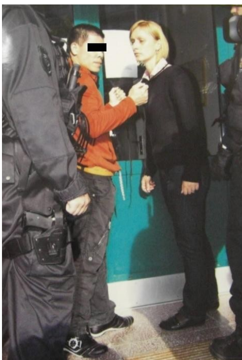
Obrázek č. 3 – Obviněný ukazuje na figurantce, jak dal poškozené kolem krku tkaničku