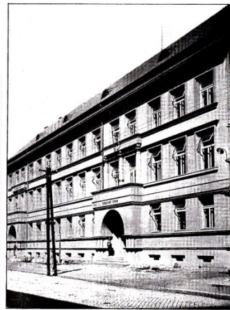
OKRESNÍ SOUD V HODONÍNĚ.