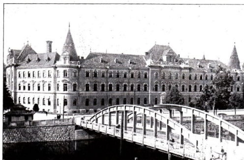
KRAJSKÝ SOUD V ČESKÝCH BUDĚJOVICÍCH.