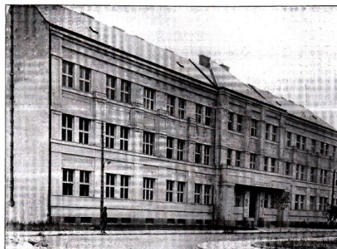
SEDRIE V UŽHORODĚ.