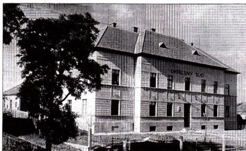
OKRESNÍ SOUD V SEČOVICÍCH.