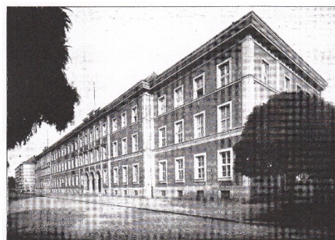
OKRESNÍ SOUD V PŘEROVĚ.