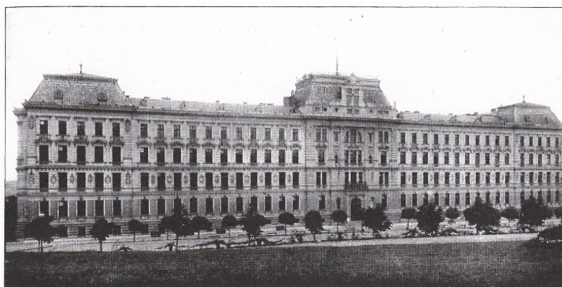
BUDOVA MINISTERSTVA SPRAVEDLNOSTI.