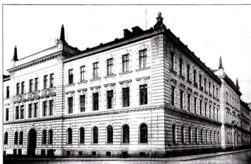
KRAJSKÝ SOUD V PLZNI.