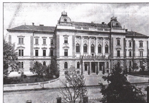
SOUDNÍ TABULE V KOŠÍCÍCH.