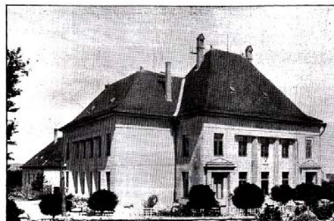
OKRESNÍ SOUD V BÁNOVCÍCH.