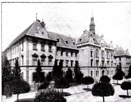
SEDNIA V B. BYSTRICI.