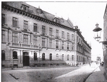
SEDNIA V BRATISLAVĚ.