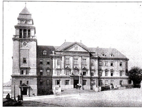
KRAJSKÝ SOUD VE ZNOJMĚ.