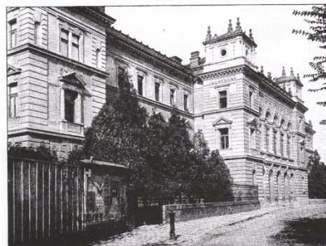
SEDNIA V KOMÁRNĚ.