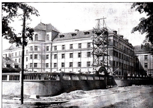
KRAJSKÝ SOUD V MLADÉ BOLESLAVI (ZADNÍ TRAKT, VĚZNICE).