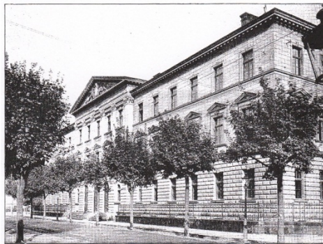
ZEMSKÝ SOUD V OPAVĚ.