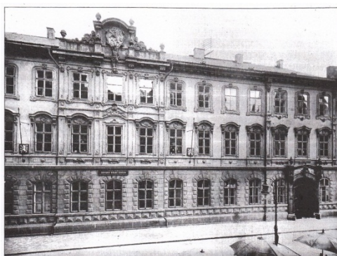
ZEMSKÝ CIVILNÍ SOUD V PRAZE.