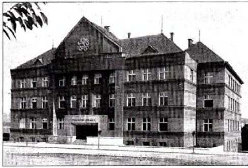
OKRESNÍ SOUD V TŘEBÍČI.